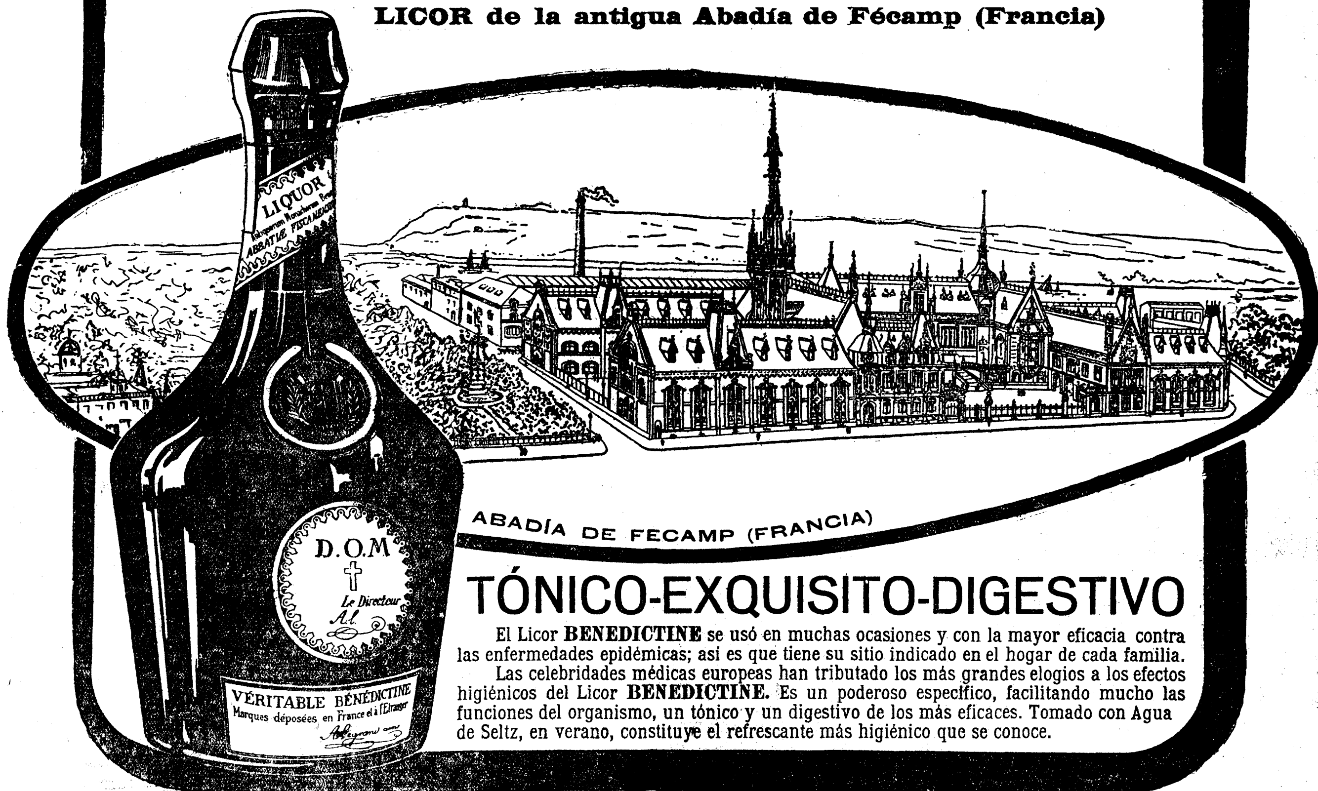
ABADÍA DE FECAMP (FRANCIA)

LICOR de la antigua Abadía de Fécamp (Francia)