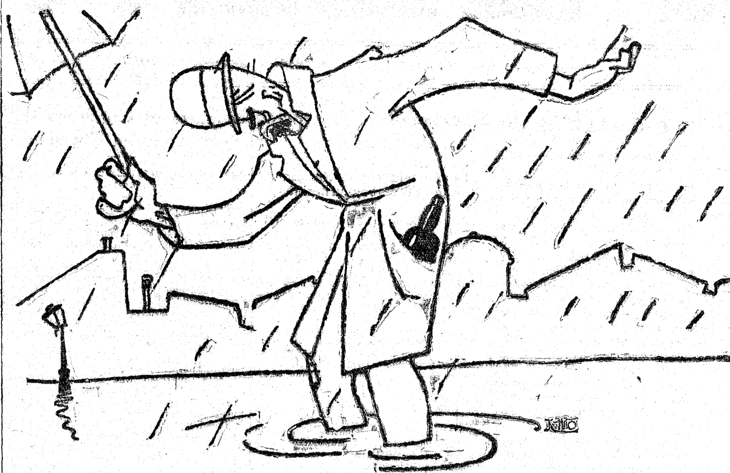
—¡Y mis pies? ¡Vaya! ¡No tengamos que lamentar otra pérdida de restos humanos!