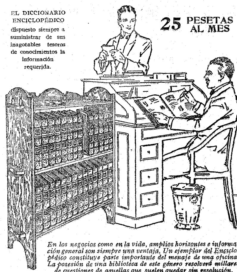
En los negocios como en la vida, amplios horizontes e información general son siempre una ventaja. Un ejemplar del Enciclopédico constituye parte importante del menaje de una oficina. La posesión de una biblioteca de este género resolverá millares de cuestiones de aquellas que suelen quedar sin resolución.

pales peritos en todos los ramos de la actividad humana. Si hay páginas en el Diccionario que permiten así al lector el penetrar en cuánto se hace o piensa por los demás seres humanos, hay otras con ayuda de las cuales puede extender su participación en la vida entera del Universo creado, desde los movimientos del enjambre de mundos gálgtricos, del que nuestro sol y su sistema forman una parte insignificante a la maravillosa organización de las hormigas; desde el proceso inmemorial que formó las rocas de la corteza terrestre a la savia que circula en la hoja de la hierba; desde las vibraciones del éter que transmiten luz a la conducta de los átomos que forman un compuesto químico.