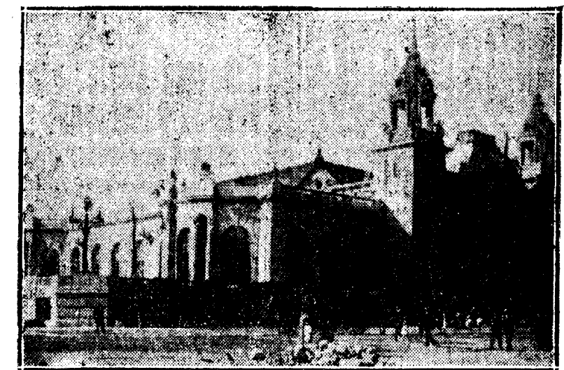
FACHADA DEL KURSAAL

de baile, del círculo y el teatro, nos han producido con sus grises y oros patinados, estilo Luis XVI, un efecto hermoso de riqueza sobria y de buen gusto, sobre los cuales se destacan admirablemente las toilettes de las distinguidas concurrentes. Más de una vez, admirando las grandes dimensiones del hall, hemos pensado en las dificultades que presentaban su decoración; todas las soluciones que se ofrecían a nuestra mente adolecían de algún inconveniente. Así es