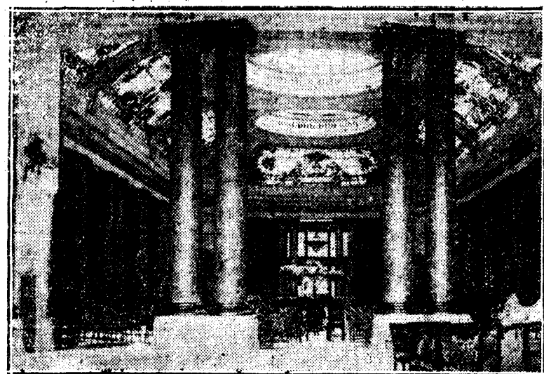
«HALL» DEL KURSAAL