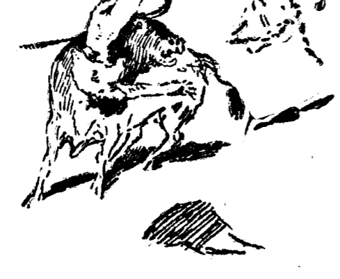
Cogida de Torquito II, en el cuarto toro.