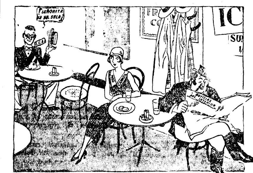
Afortunadamente, esto ya no ocurrirá en adelante, porque John Bull se preparará de los países que le acompañan.