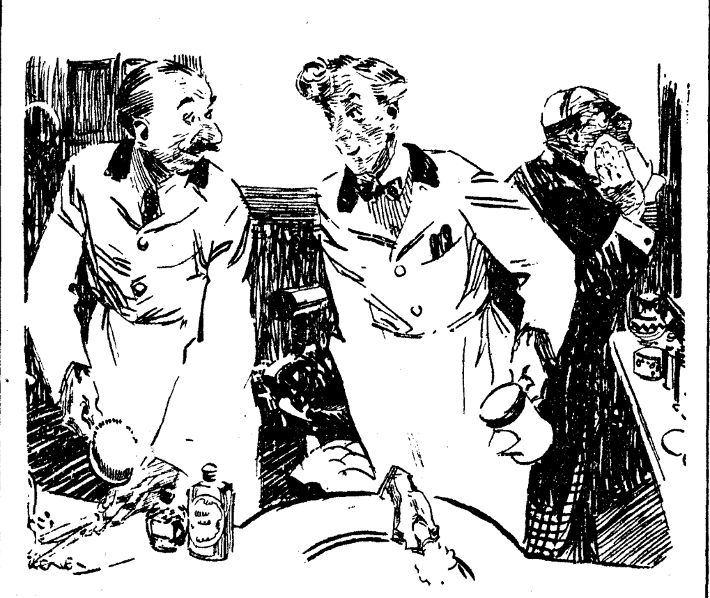
—¡Vaya tajo que le ha hecho usted a ese pobre señor! —Si. Es que soy novio de su criada, y esa es la señal convenida para que sepa que irá a buscarla el domingo. (Passing Show, Londres.)