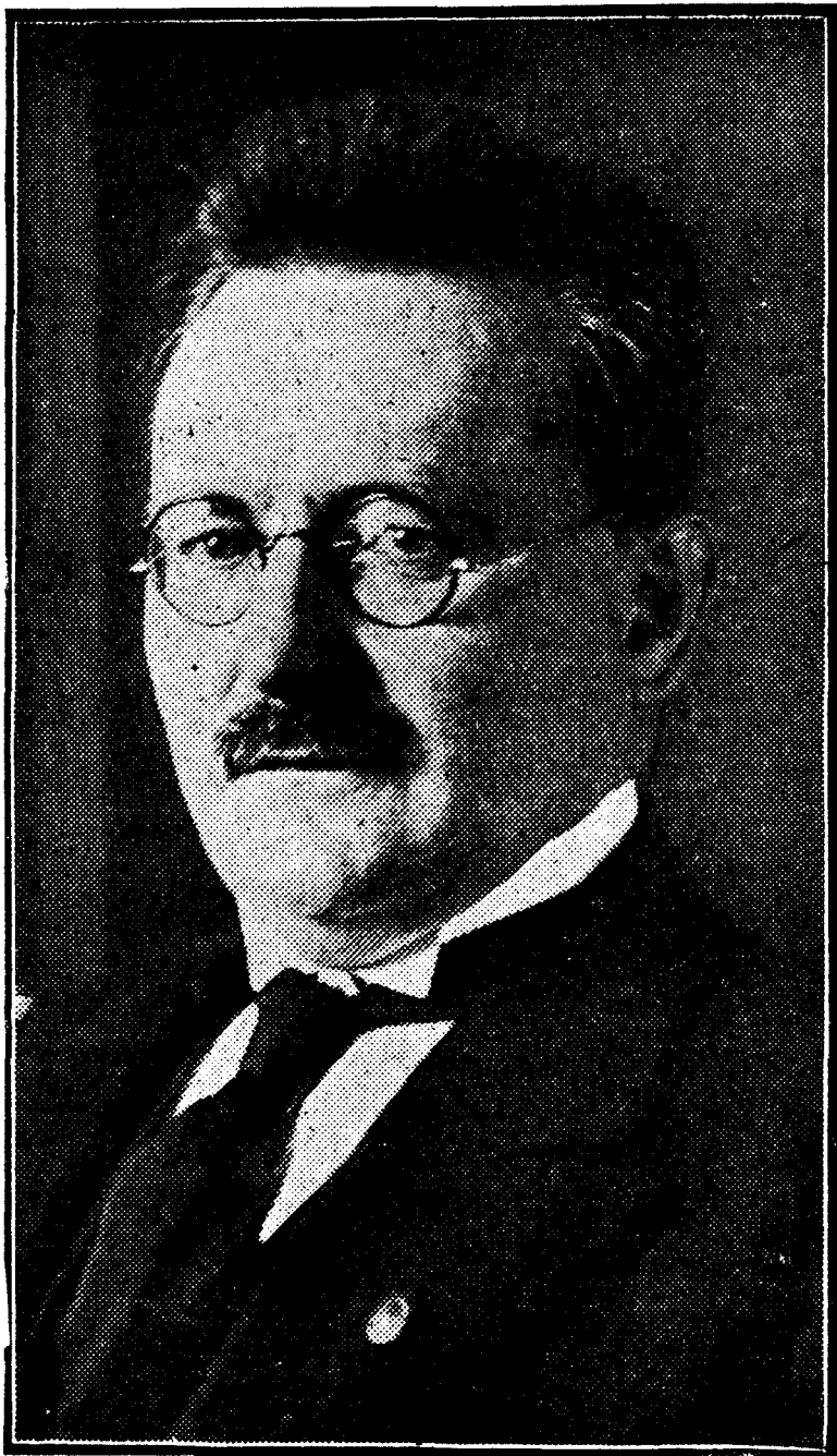
Doctor P. Loebe, presidente del Reichstag

El nombre del doctor Loebe ha corrido en los días últimos toda la Prensa europea. El discurso del presidente del Reichstag en la Conferencia interparlamentaria ha expresado de una manera rotunda los anhelos alemanes por lo que se refiere a la ocupación. No ha vacilado el doctor Loebe en plantear ante sus colegas de todo el mundo el problema de la evacuación total. Ha solicitado ésta, y la ha considerado como el camino más directo hacia la pacificación de todos deseada. Los comentarios al discurso han sido muy diversos.