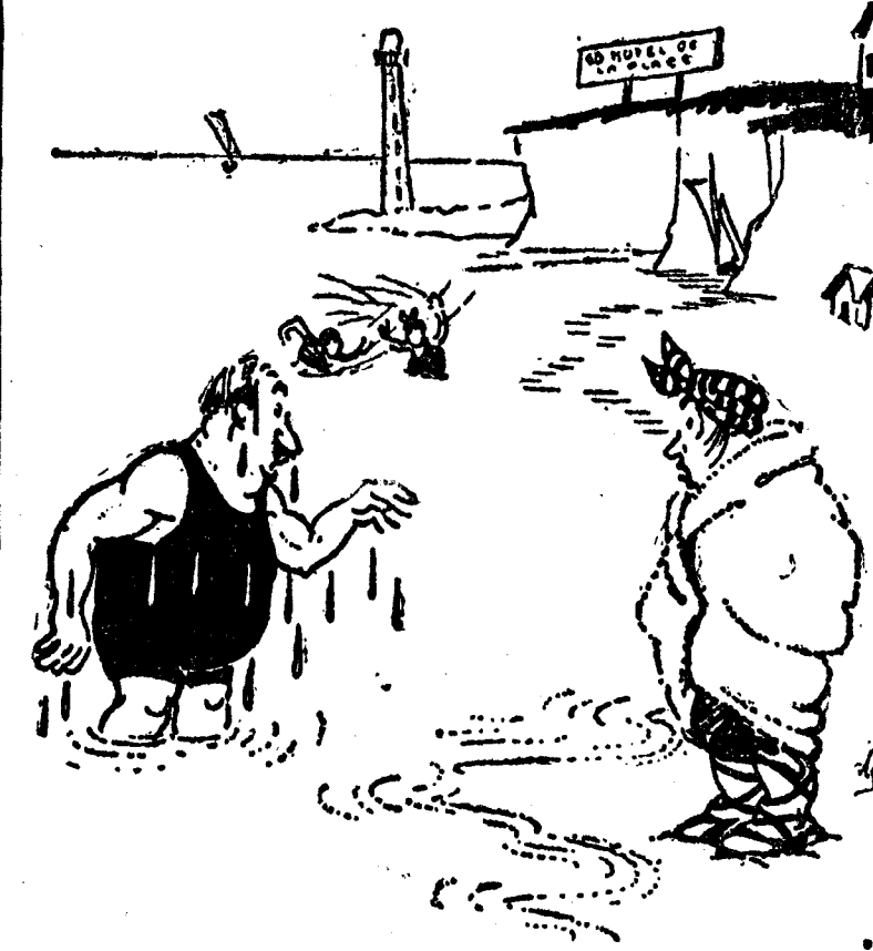
—¿Cómo está hoy el agua? —Yo la encuentro muy salada. (Pele-Mole, París.)