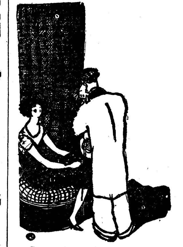
—Está usted triste, doctor. —Es que he perdido dos de mis enfermos. —¿Se han muerto? —No. Se han curado. (Dimanche Illustré, París.)