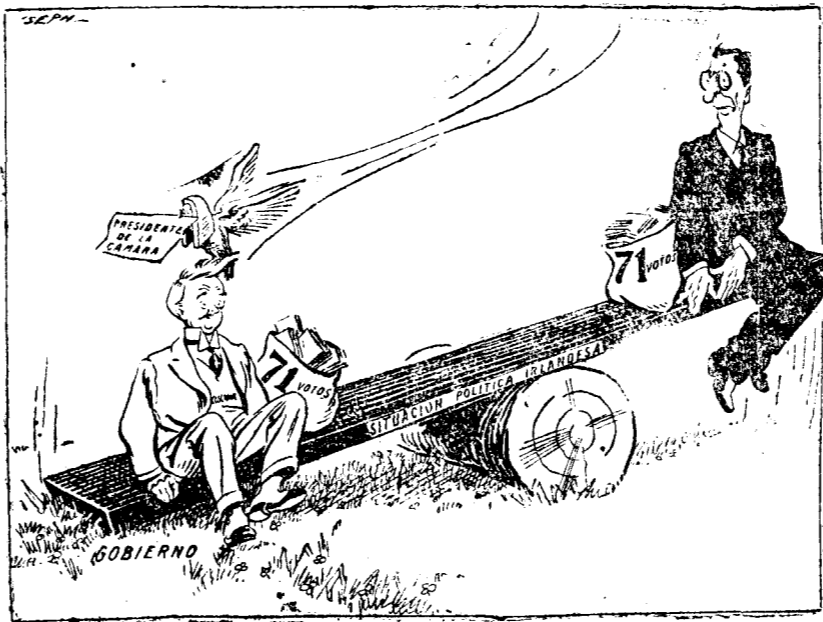
GRAFICO DE LA ULTIMA VOTACION DE LA CAMARA IRLANDESA (Del Daily Chronicle, Londres.)