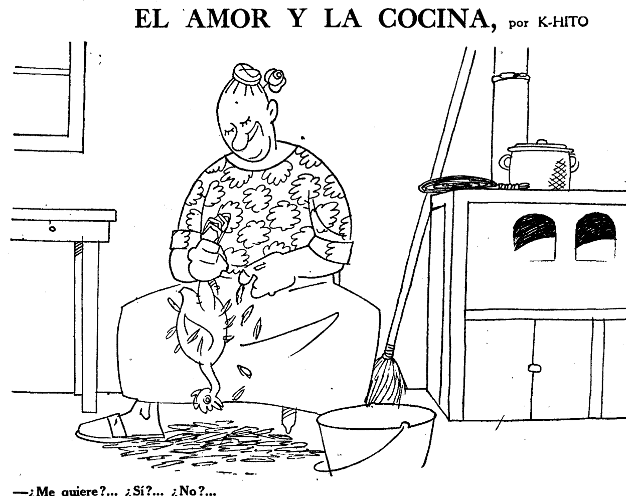
—¿Me quiere?... ¿Si?... ¿No?...