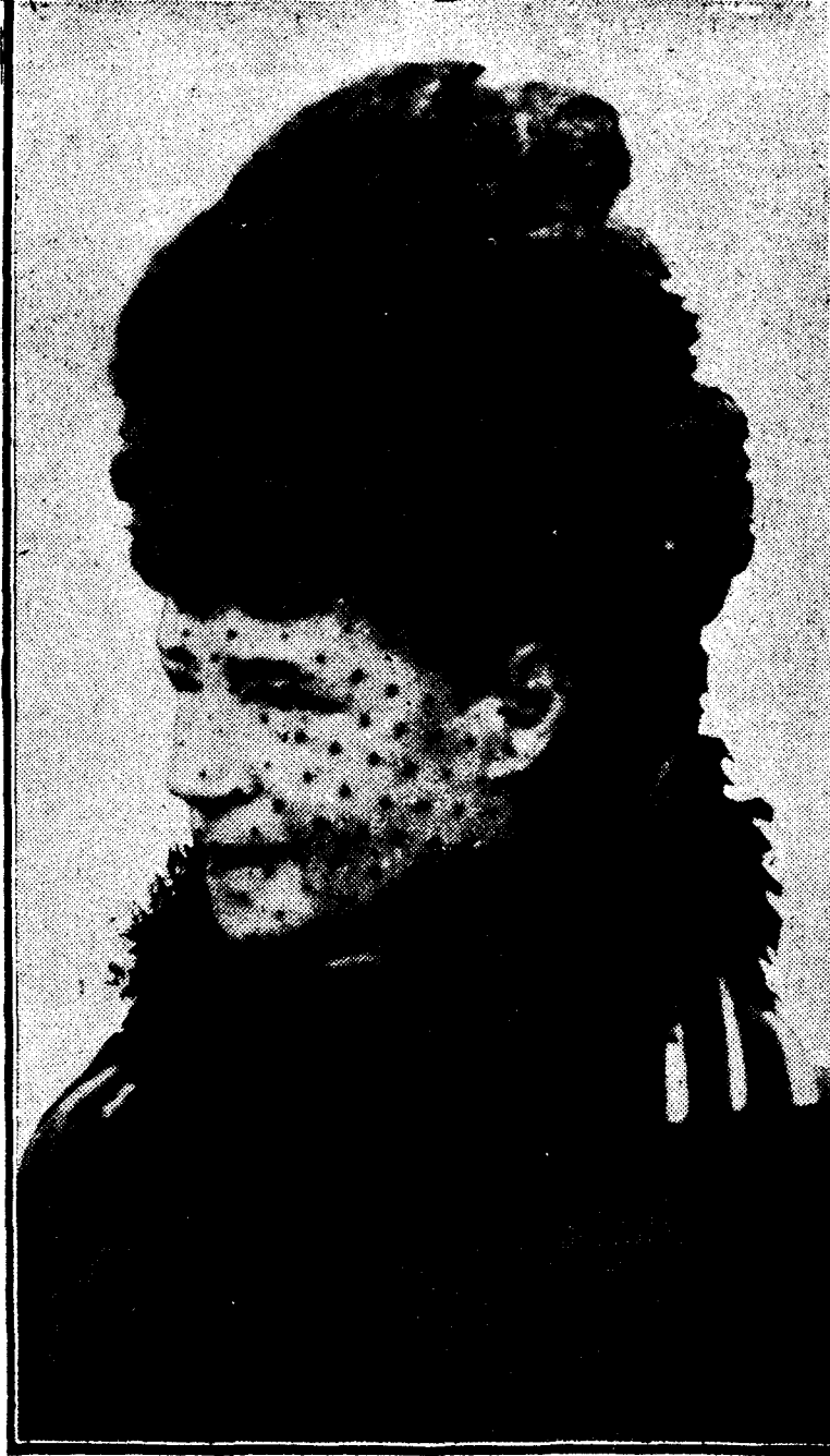
La Emperatriz viuda de Rusia, madre del Zar Nicolás II, que está gravemente enferma

SEVILLA, 10.—El alcalde de esta ciudad, que se halla en Madrid, ha conferenciado telefónicamente con el gobernador civil y el alcalde interino, a quienes manifestó que ha entablado gestiones para conseguir que con el dinero del empréstito concertado con el Banco de Crédito Local se puedan acometer obras nuevas y se hagan transferencias.