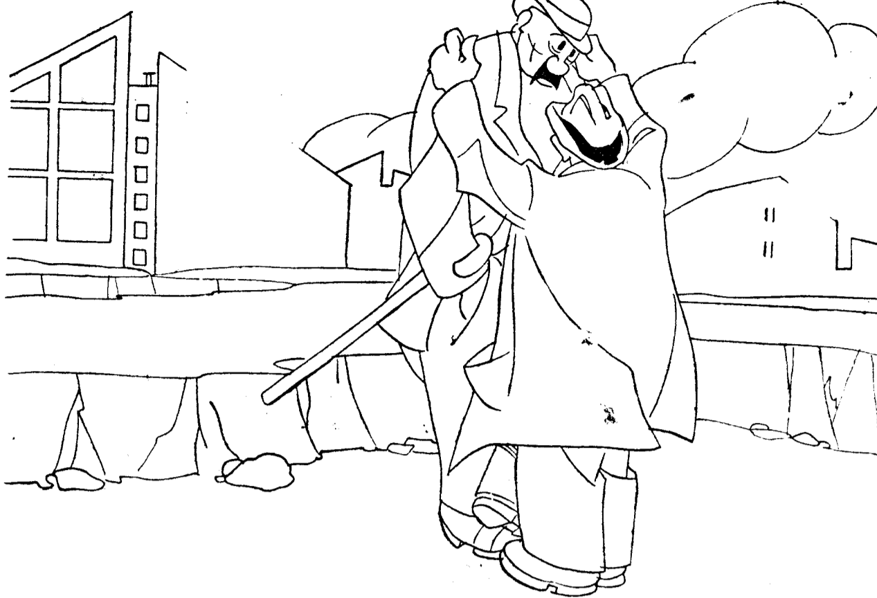
—Habrá usted visto que desde el cuarto "round" Tunney le castigó el hígado a su adversario. —Sí; creo que se lo puso encima de la mesa, de rodillas.

Pero ¿no se habrá llevado consigo Colom la llave de su misterio? ¿Y no se exagerará demasiado, de una manera desmedida la acción histórica de Colom, genovés o peninsular? La interpretación psicológica de Marius An-