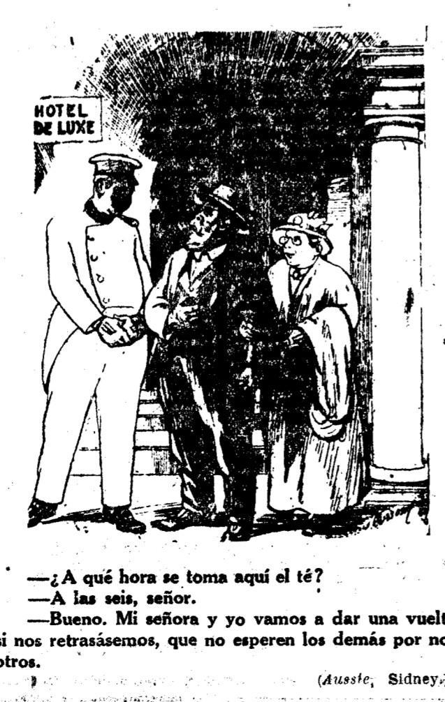
—¿A qué hora se toma aquí el té? —A las seis, señor. —Bueno. Mi señora y yo vamos a dar una vuelta; si nos retrasásemos, que no esperen los demás por nosotros. (Aussie, Sidney.)