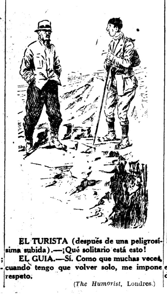
EL TURISTA (después de una peligrosísima subida).—¡Qué solitario está esto! EL GUIA. —Sí. Como que muchas veces, cuando tengo que volver solo, me impone respeto. (The Humorist, Londres.)