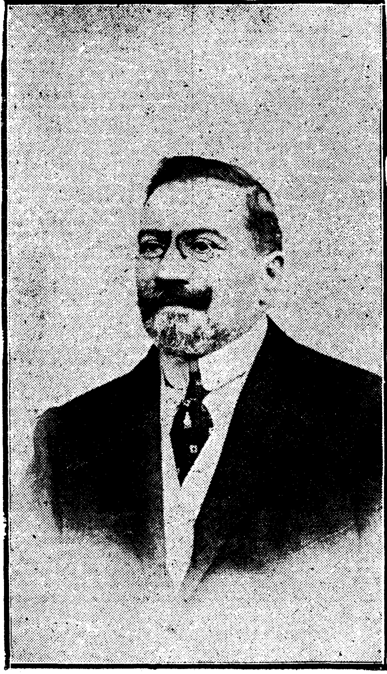
Don Juan Vázquez de Mella, que ha renunciado por motivos de salud a su nombramiento de asambleista

Su renuncia al cargo de asambleista ha puesto de actualidad la noble y simpática figura de este ejemplar hombre público. Aunque bien puede decirse en honor de la verdad que Mella ha sido figura de actualidad política durante todo el período excepcional que atravesamos. Y no por su actuación personal en estos años, sino porque el Gobierno de Primo de Rivera es el cumplimiento de una profecía bellamente expresada por el ilustre tribuno: «Durante el período de transición, que se acerca, del antiguo régimen a un nuevo estado de cosas, la autoridad soberana tendrá que refugiarse en la tienda de campaña de la dictadura.»