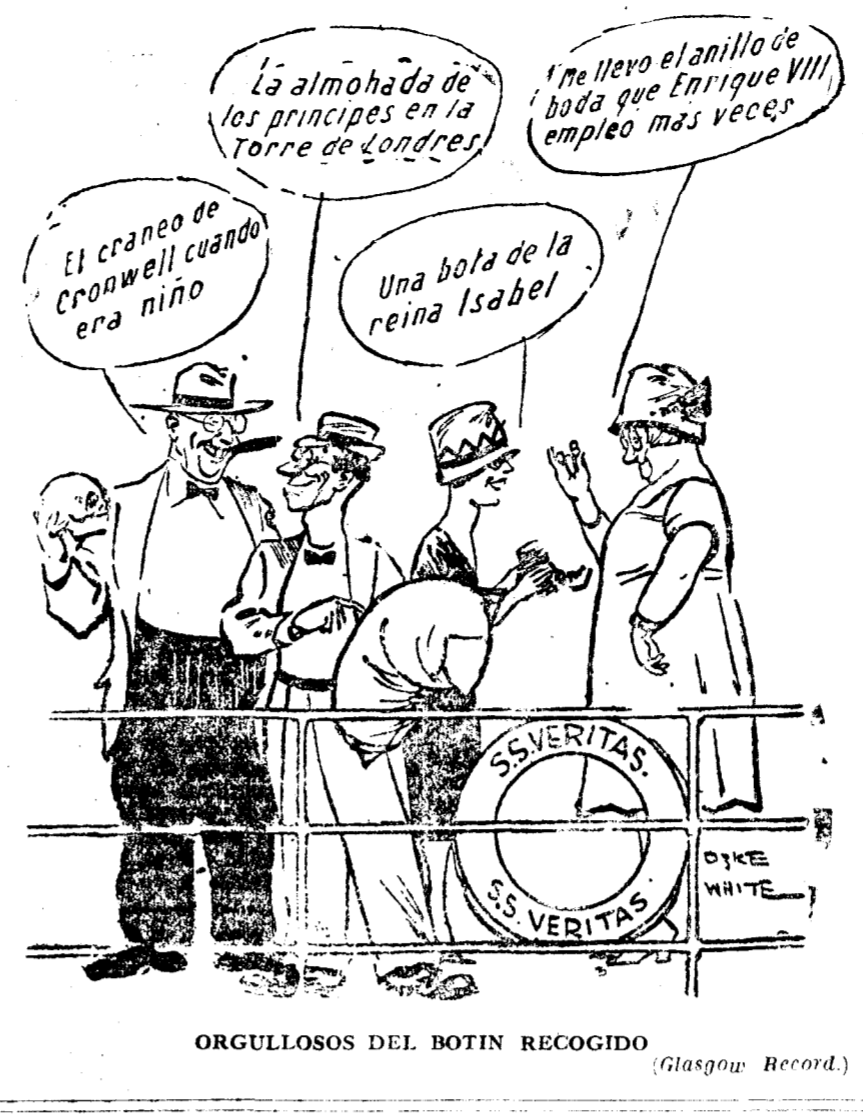
ORGULLOSOS DEL BOTIN RECOGIDO (Glasgow Record.)