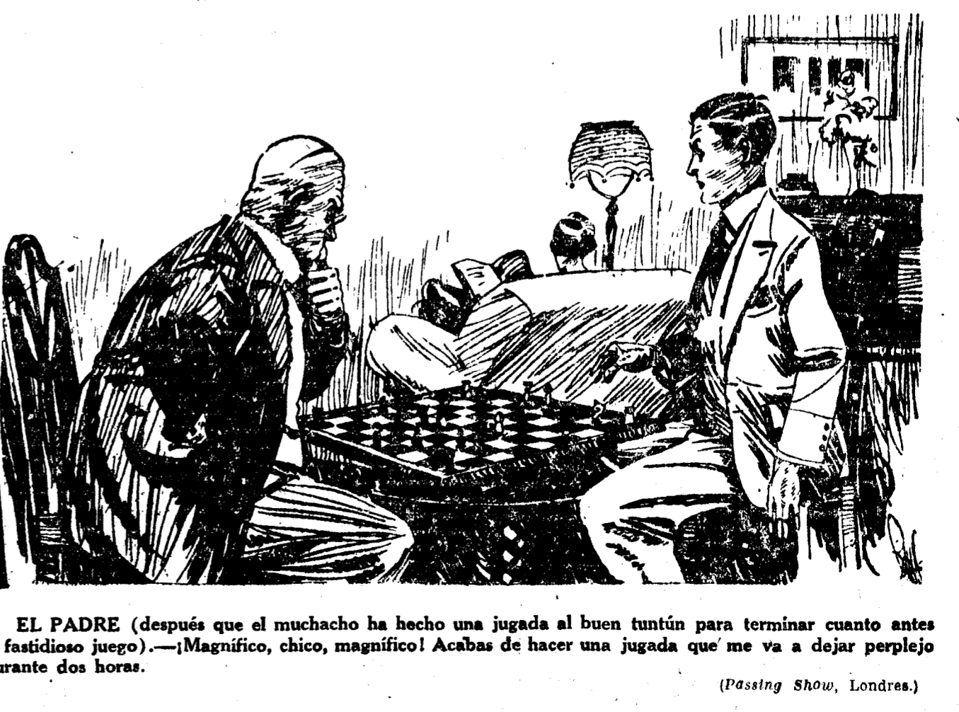
EL PADRE (después que el muchacho ha hecho una jugada al buen tuntún para terminar cuanto antes el fastidioso juego).—¡Magnífico, chico, magnífico! Acabas de hacer una jugada que me va a dejar perplejo durante dos horas. (Passing Show, Londres.)