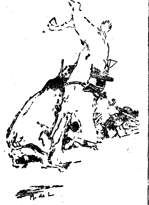
Formidable casta en el quinto toro.