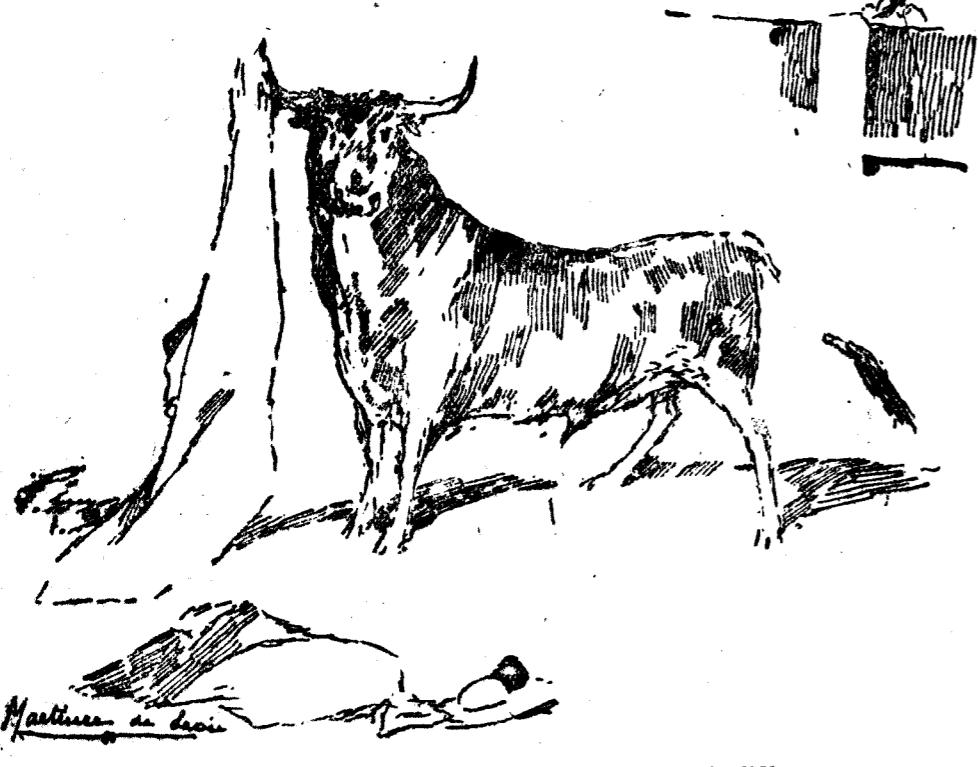
Uno de los momentos de mayor orden en la lidia.

el muchacho muy bien y fué aplaudido justamente.