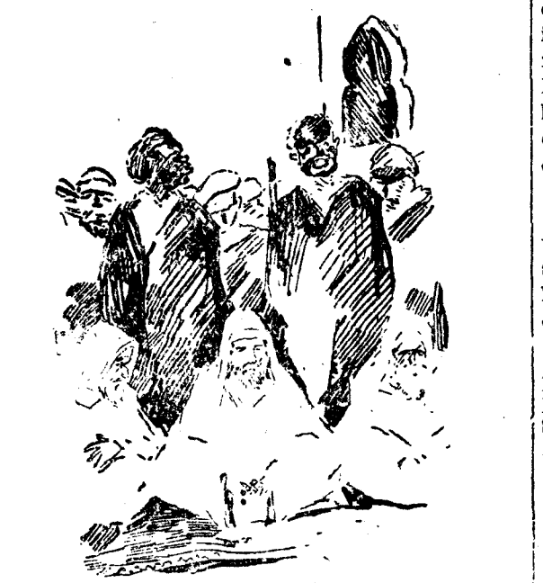
En el centro de la burbana media luna...

apenas del fino y blanquísimo jaique, se destrozaban las negras y redondas cuentas de su rosario islamita. Por su noble continente atraía