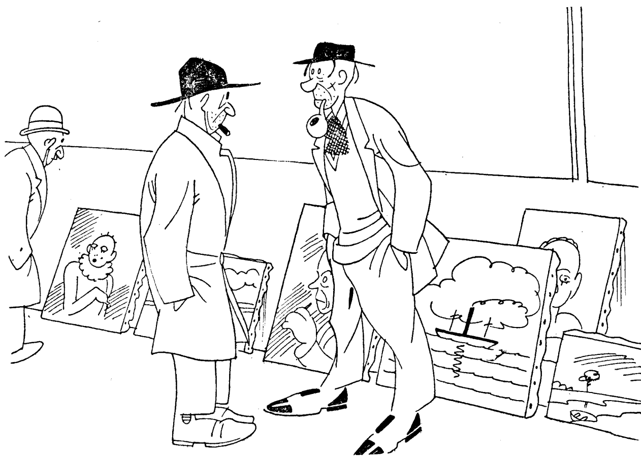
—Oye, y si no me encontrases aquí, es que estoy en la Asamblea de poseedores de marcos.