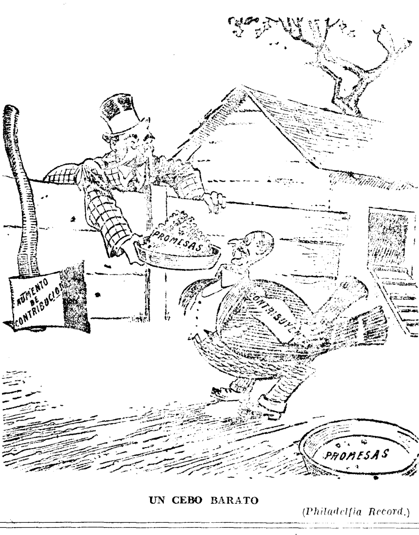
UN CEBO BARATO (Philadelfia Record.)