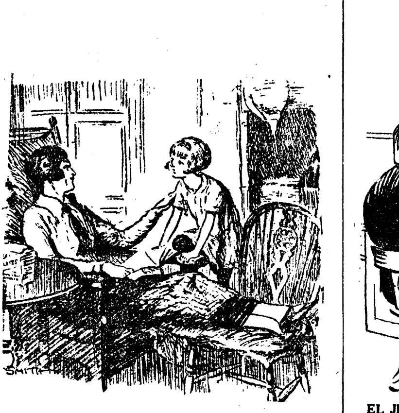
DULZURAS LA NENA.—Quiero que me cuentes un cuento que necesite bombones para oirlo. (The Humorist, Londres.)