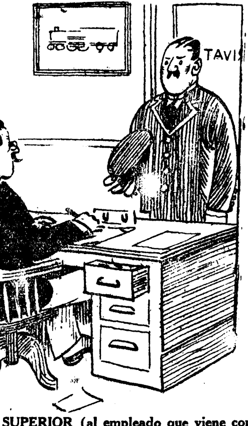
EL JEFE SUPERIOR (al empleado que viene con una queja).—¿Y por qué no ha ido usted con esa historia al superintendente? EL EMPLEADO.—También he ido a su despacho. Pero me dijo que me fuera al diablo... ¡y aquí estoy! (London Opinion, Londres.)