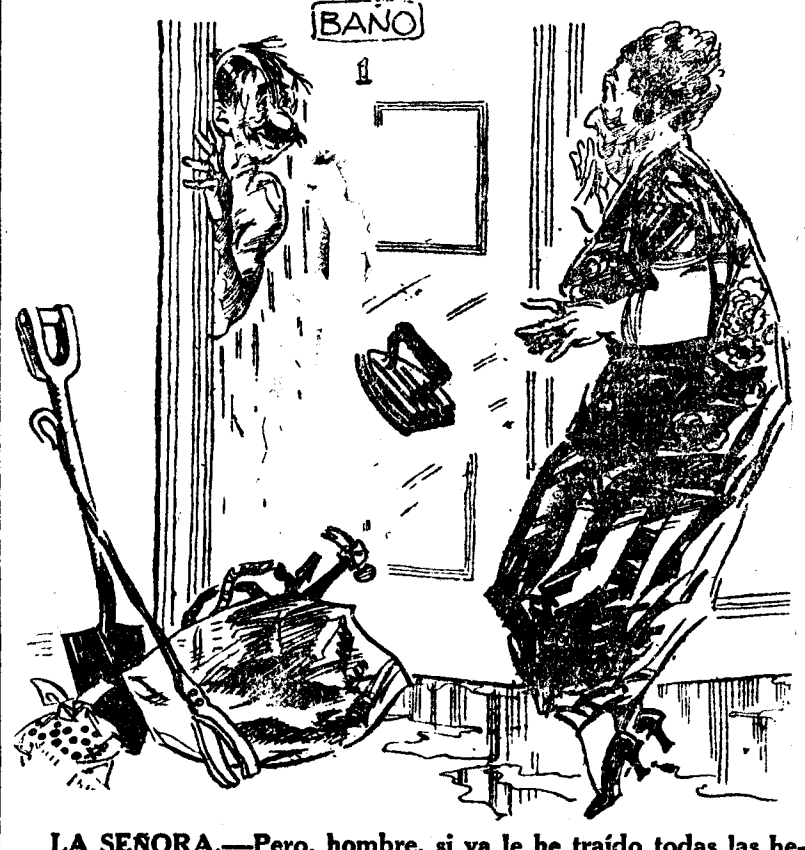
LA SEÑORA.—Pero, hombre, si ya le he traído todas las herramientas que había en la casa, ¿qué quiere usted ahora? EL FONTANERO.—Una toalla de baño y un poco de jabón, señora...