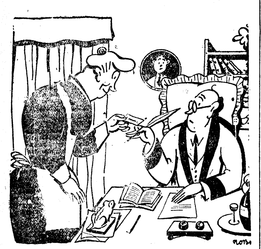
—No olvides que te dije que no estaba en casa si el visitante era algún pelma. —No señorito; no lo es. Ya se lo he preguntado. (The Passing Show, Londres.)