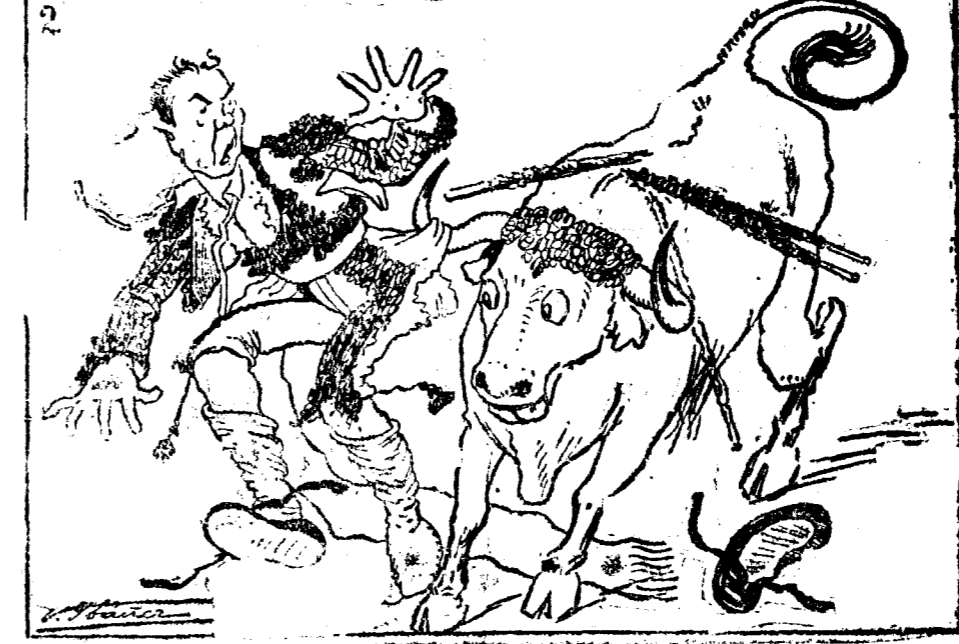
LA "TOILETTE" DEL "MATAOR"

1.—El que lo viste... 2.—...Y el que lo desnuda