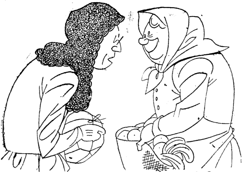
—Bueno, pero ¿qué es eso de fotografías milimétricas? —Son unas que entran mil en la media docena.