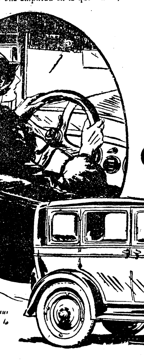
Los nuevos colores de sus carrocerías aumentan la belleza del Chevrolet

nas encontrarán la comodidad que nunca sañaron obtener en un coche de este precio. A su motor cuatro cilindros de válvulas en cabeza se le han introducido refinamientos que lo hacen aún más silencioso, más fuerte y de más rápida aceleración. En su construcción ha intervenido uno de los grupos de ingenieros más famosos del mundo que al mismo tiempo han conseguido reducir asombrosamente su consumo. Los frenos a las cuatro ruedas, de nuevo sistema y de gran superficie, ofrecen la seguridad más absoluta. Examine usted mismo detalladamente el nuevo Chevrolet 1928, siendo la mejor manera de que aprecie sus cualidades de coche de gran lujo. El concesionario más próximo se verá muy gustoso de darle cuantos datos necesite sobre este nuevo modelo.