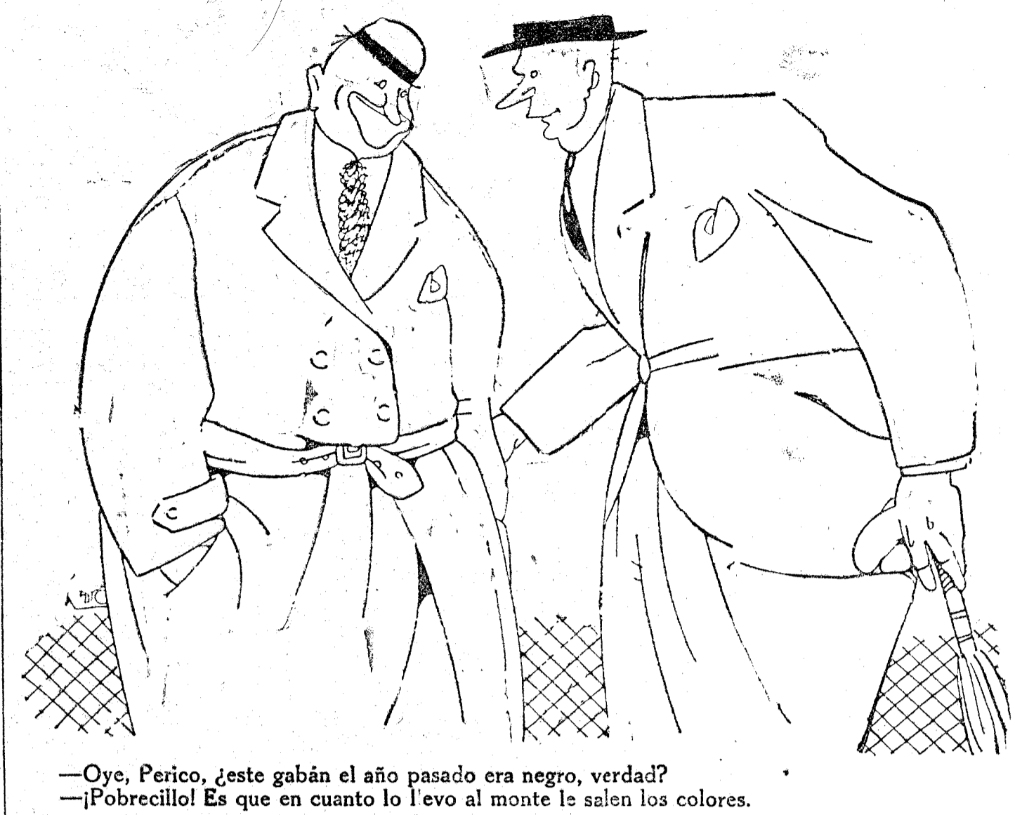
—Oye, Perico, ¿este gabán el año pasado era negro, verdad? —¡Pobrecillo! Es que en cuanto lo llevo al monte le salen los colores.