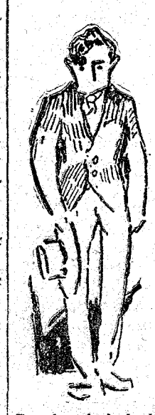
En el umbral de la puerta apareció el «Pintao».

Folleón de EL DEBATE 108 —¡Ha cogido un toro al señor Curro y se está muriendo! Rocio y Manuela lanzaron un grito de dolor y se abrazaron llorando. Sacando fuerzas de su angustia, arrebató Rocio el papel al chico. —¿Pero cómo ha sido? ¿Donde lo dió? Y recorrió anhelante el periódico, que le temblaba en las manos. Apenas daba noticias, en la prisa por salir pronto a la calle, para aprovechar el suceso. Sólo contaba que al matar el quinto toro había sido herido Currito en el cuello, entrando en la enfermería con una cornada muy grave, «causando la cogida dolorosa impresión en el público». Y más abajo agregaba: «Las impresiones que vienen de la enfermería son pesimistas. Se teme un funesto desenlace.» A un tiempo curiosas y compasivas, acudieron algunas vecinas dando consuelos. El albán de al lado advirtió a las angustiadas mujeres que no había que hacer caso de los papeles y los vendedores, que eran unos «desagoreros» que lo abultaban todo para vender más. En la calle sonaron nuevos pregones de otros periódicos, con ese estridor alarmante que emplean los hábiles vendedores de esta mercancía para despacharla pronto. —¡...con la cogida y muerte del Chavalillo!... Rocio, horrorizada, se tapó convulsivamente los oídos y apeló con un grito desgarrador al Cielo. —¡No, Virgen mía, de mi alma! ¡No! Manuela desplomóse acongojada en una silla. El grupo de vecinas guardó un silencio fúnebre. En el umbral de la puerta apareció el Pintao,