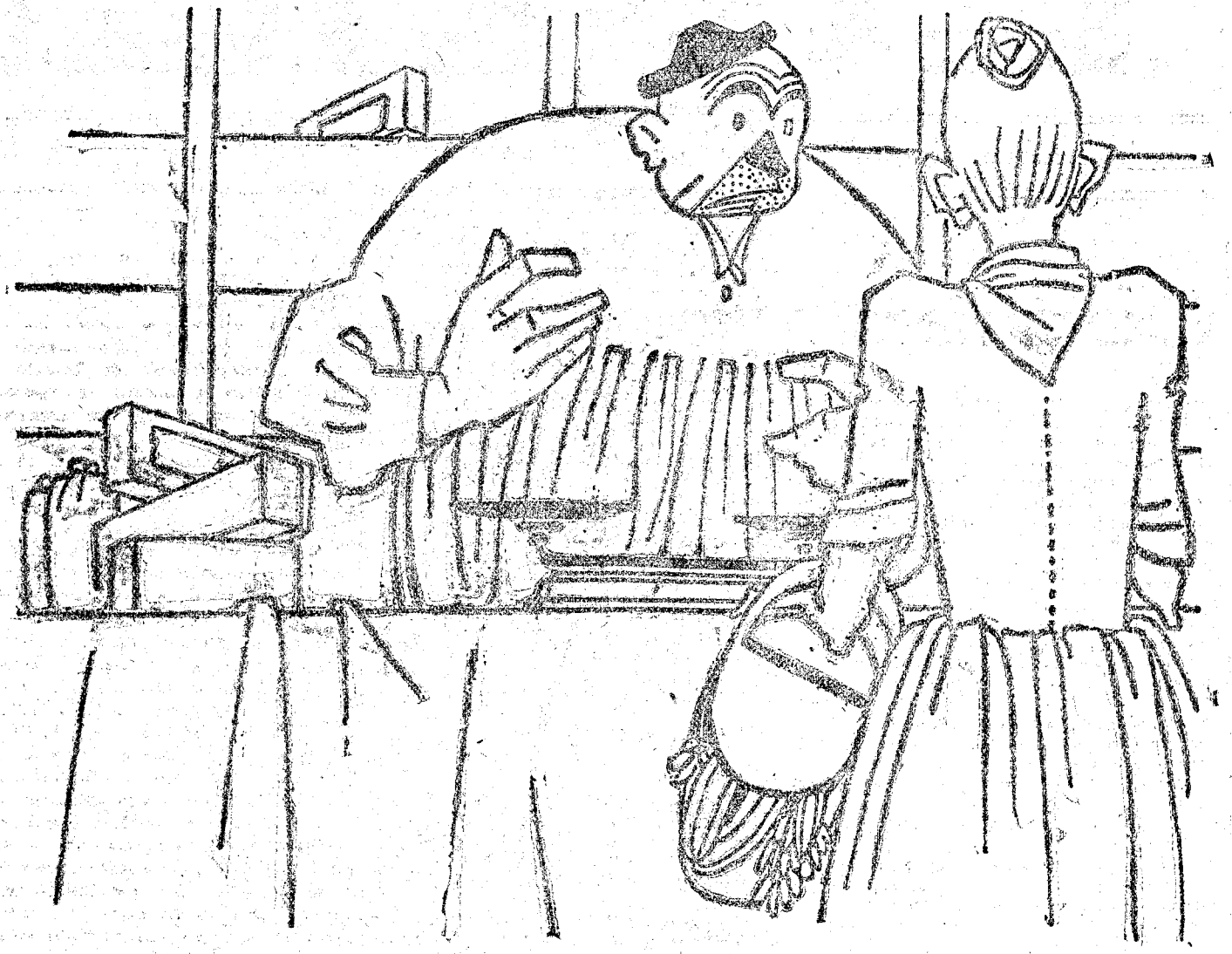
—¡Oh, señora! Yo he recorrido todo el mundo vendiendo turrón... Lo que no quisiera es morir sin conocer Jijona.