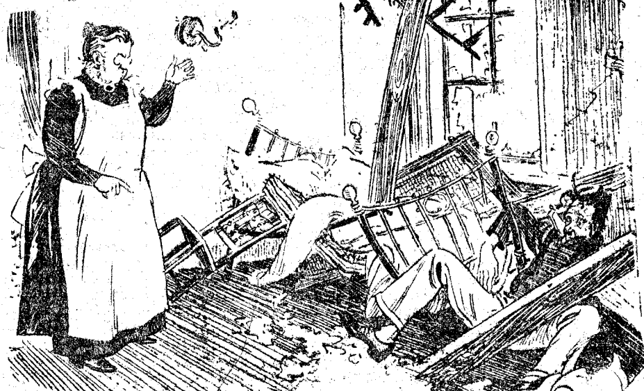
LA PATRONA (al huésped, víctima de una explosión de gas).—Si continúa usted gastando tanto gas, se tendrá que ir de la casa. ("The Humorist", Londres.)