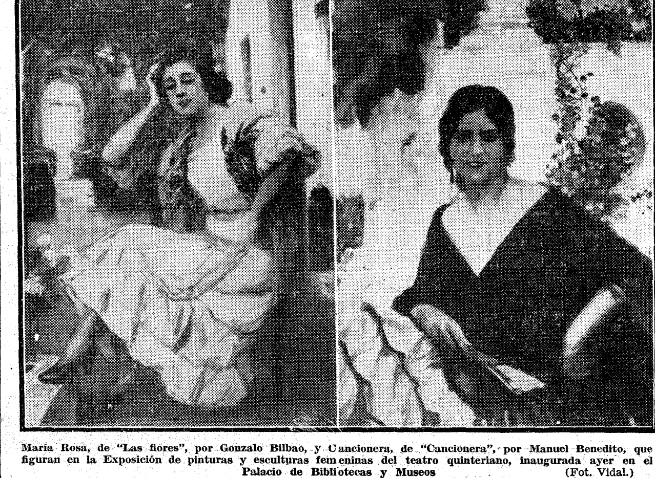
Maria Rosa, de "Las flores", por Gonzalo Bilbao, y Cancionera, de "Cancionera", por Manuel Benedito, que figuran en la Exposición de pinturas y esculturas femeninas del teatro quinteriano, inaugurada ayer en el Palacio de Bibliotecas y Museos.

Hay muchos automóviles en Palestina. JERUSALEN, 20.—Según estadísticas que acaban de publicarse, hay en Palestina un automóvil para cada 336 habitantes.