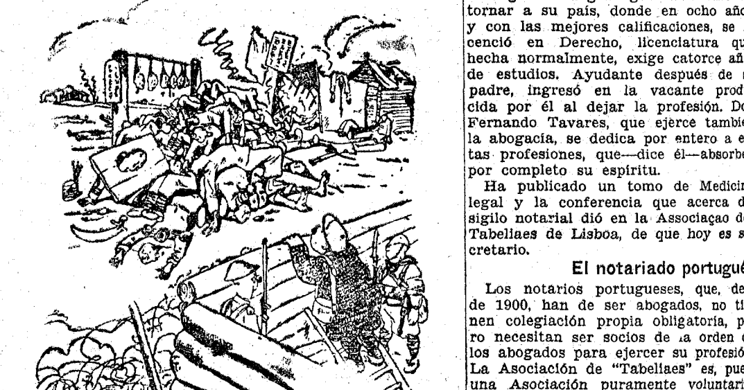
COSAS DE CHINA. EL REPORTER.—¿Qué hubo allí? EL SOLDADO INGLÉS.—Una reunión del partido moderado.