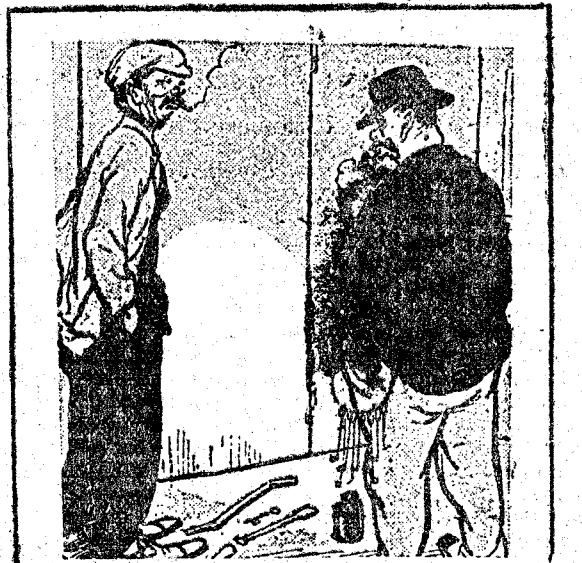
—Y en cuanto nos hagamos con los cuartos, mucho cuidado. —Sí; abundan mucho los ladrones. ("Le Rire", París.)

EL REPORTER.—¿Qué hubo allí? EL SOLDADO INGLÉS.—Una reunión del partido moderado.