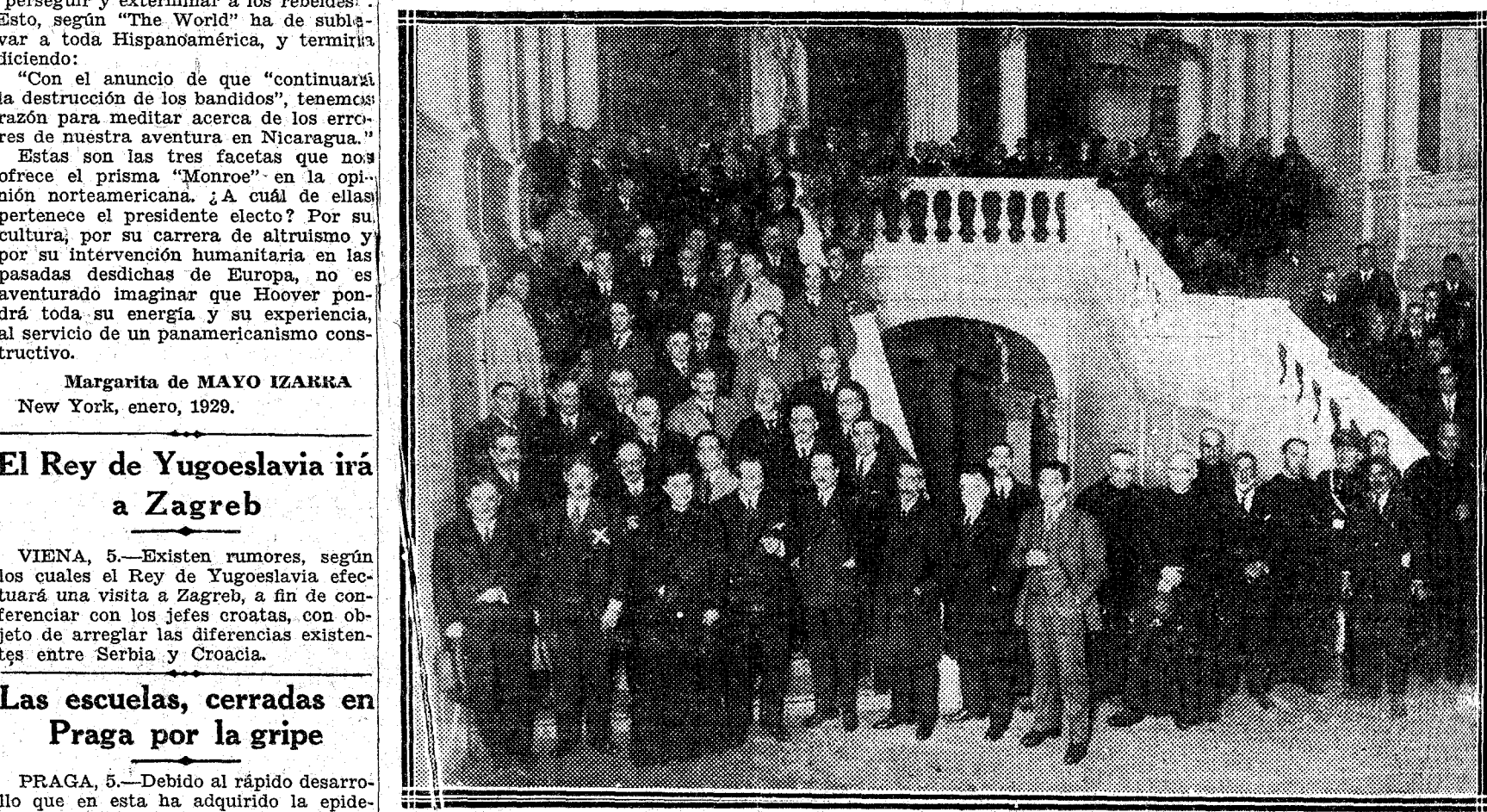
Durante la reciente visita del ministro de Economía Nacional, conde de los Andes (X), a la capital de Vizcaya fué agasajado con un banquete en la Universidad de Deusto, en cuyas aulas hizo aquél la carrera de Derecho