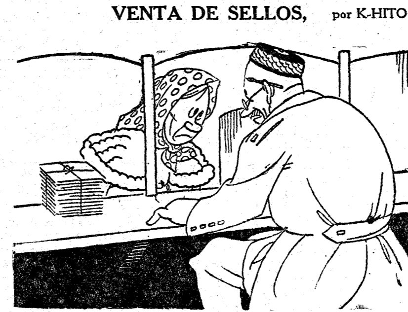
—Pero, ¿qué clase de sellos quiere? ¿Son para el interior? —Sí, señor, sí. Para tomar dos después de las comidas.