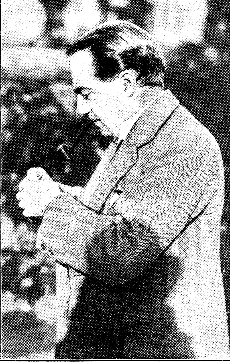
Mister Stanley Baldwin, presidente del Consejo de ministros de Inglaterra, que ha expuesto en un discurso el programa del partido conservador para las próximas elecciones

Personalidad interesante la del primer ministro inglés. Hombre de formación sólida, de práctica y experiencia. Educado en los clásicos y hecho en los negocios. Sabe latín y contabilidad; procede como un técnico y habla como un poeta. Heredero de Bonar Law en la jefatura del partido conservador, ha sabido mantenerse en ella con tacto a través de innumerables dificultades que ha tenido que afrontar en su larga etapa de Gobierno. Es flemático como buen inglés y tiene, como corresponde a un tipo completo, sus rasgos felices de humorismo. No perdona fácilmente sus vacaciones. Fuma en pipa.