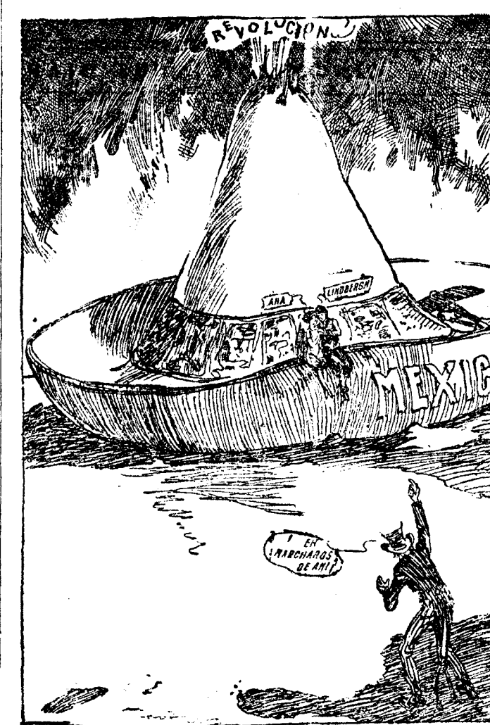
AL PIE DEL VOLCAN ("Boston Post")