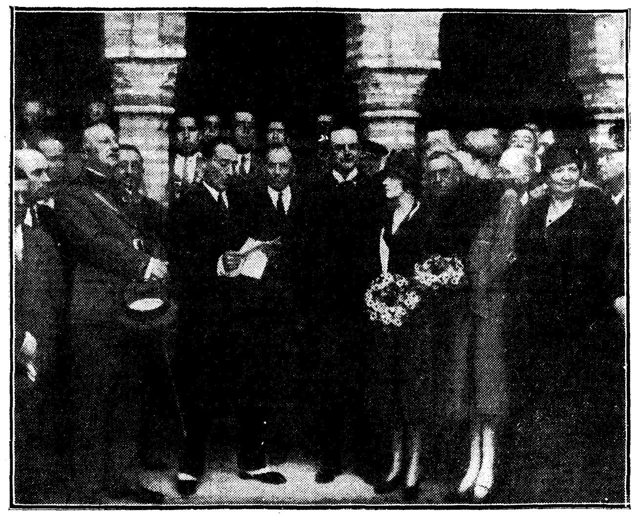
El duque de Alba leyendo un discurso durante la visita que hicieron al Monasterio de la Rábida el general Primo de Rivera y demás personalidades que asistieron a la inauguración del monumento a Colón en Huelva