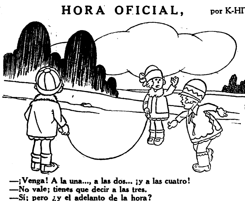
—¡Venga! A la una... a las dos... ¡y a las cuatro! —No vale; tienes que decir a las tres. —Sí; pero ¡y el adelanto de la hora!