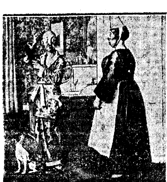
TIEMPOS NUEVOS —Señor; los ladrones de la casa vienen a felicitar a usted las Pascuas. —Dales las gracias y alguna coquilla. (Dibujo de Gebault.)