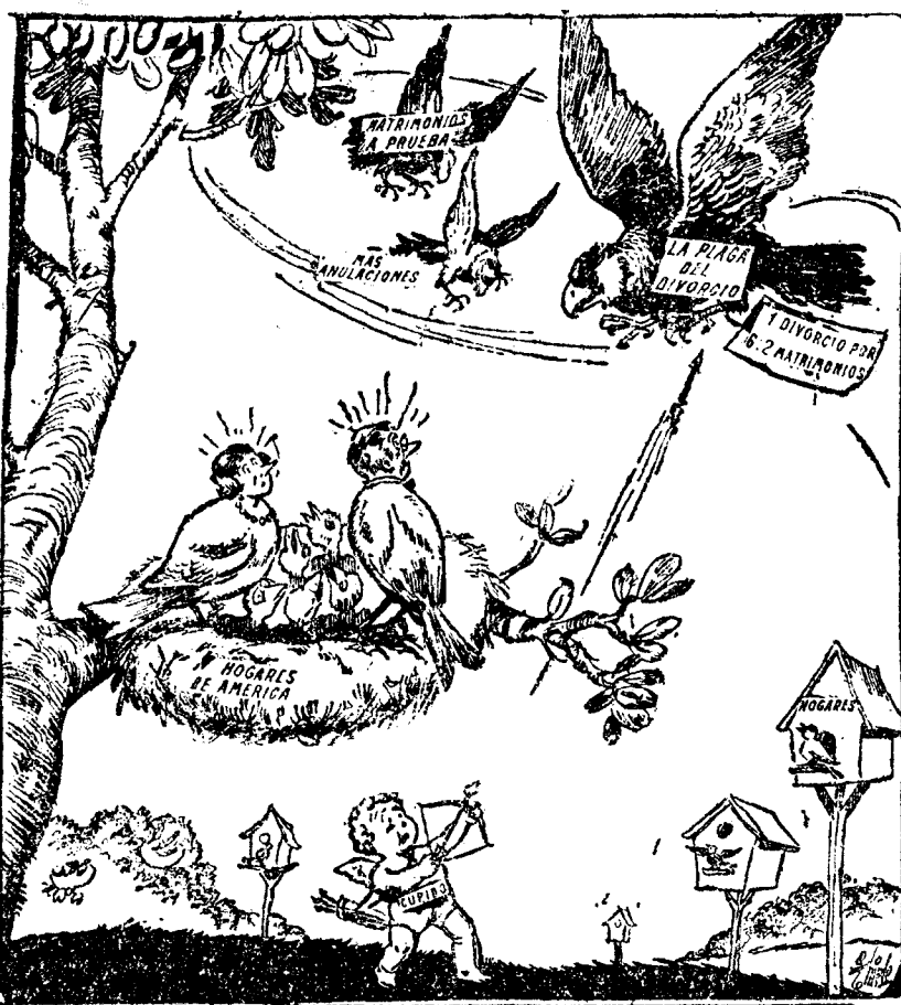
¡CUIDADO CON LOS GAVILANES!