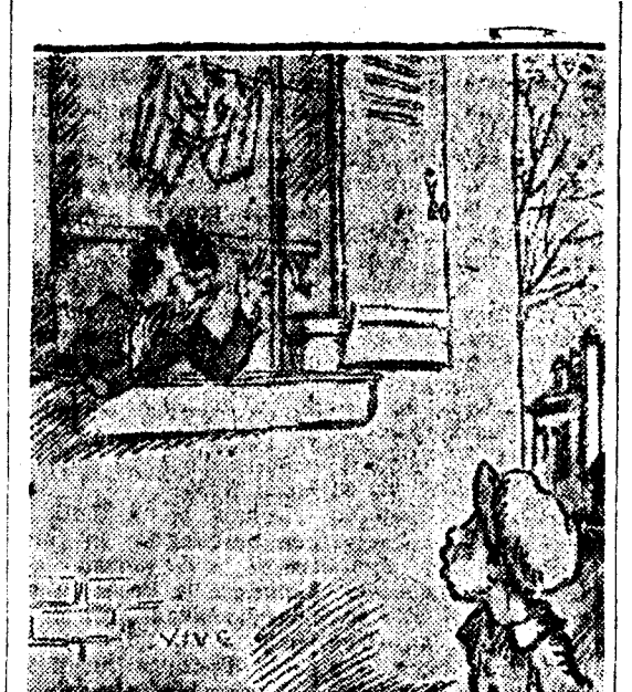
LA VERDADERA RAZON —Espera cinco minutos, hasta que se me seque el pantalón. (Dibujo de Poulbot.)