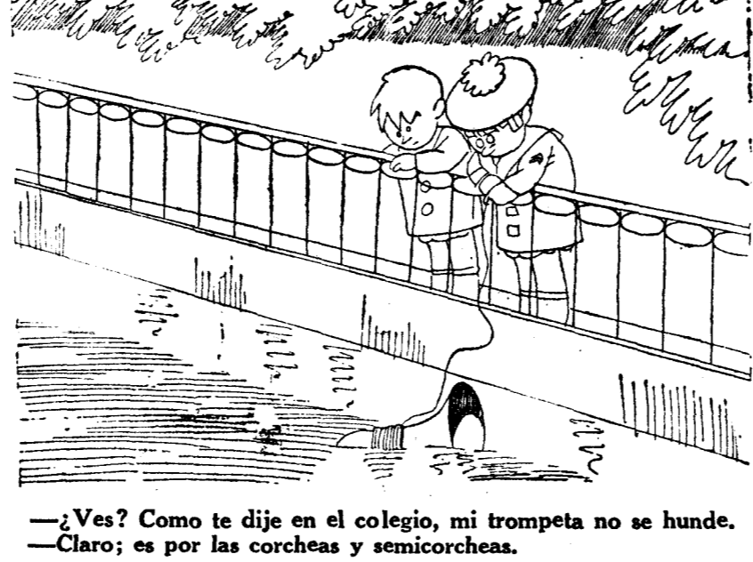
—¿Ves? Como te dije en el colegio, mi trompeta no se hunde. —Claro; es por las corcheas y semicorcheas.