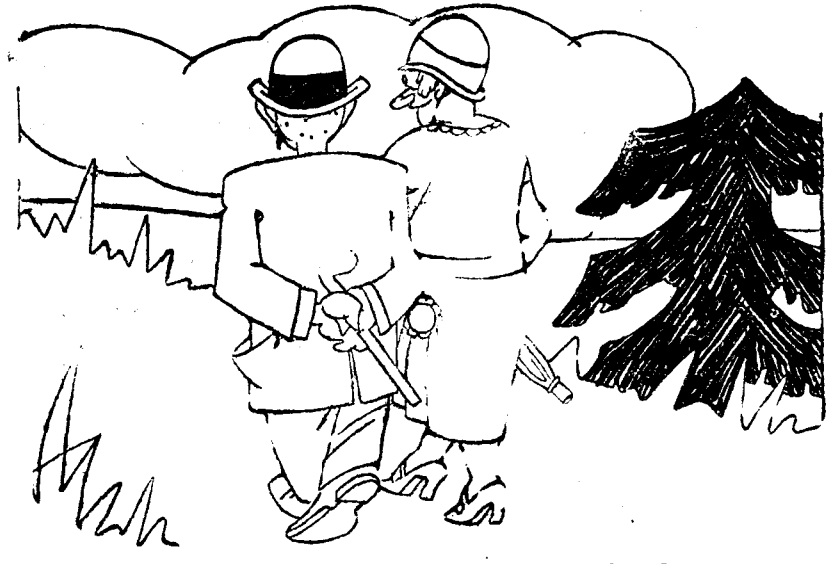
—Quiero, Manolo, que me obseques con un salto de cama. —Bueno; pero no creas tú que me encuentro muy ágil.