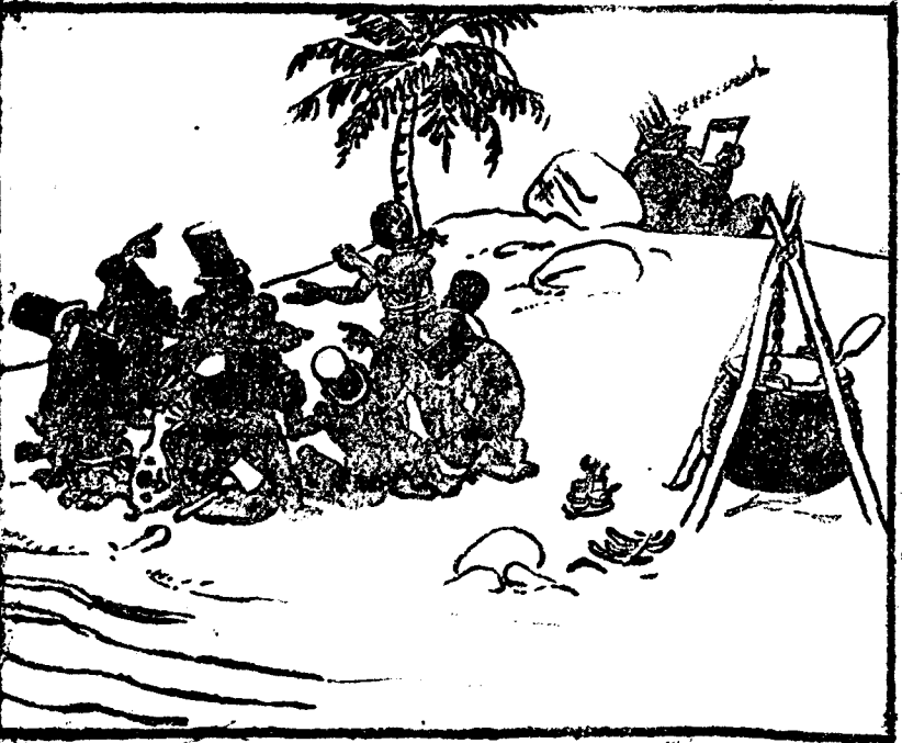
EL PRISIONERO ES PEQUEÑO, Y TODOS QUIEREN COMER ("The Evening Standard")