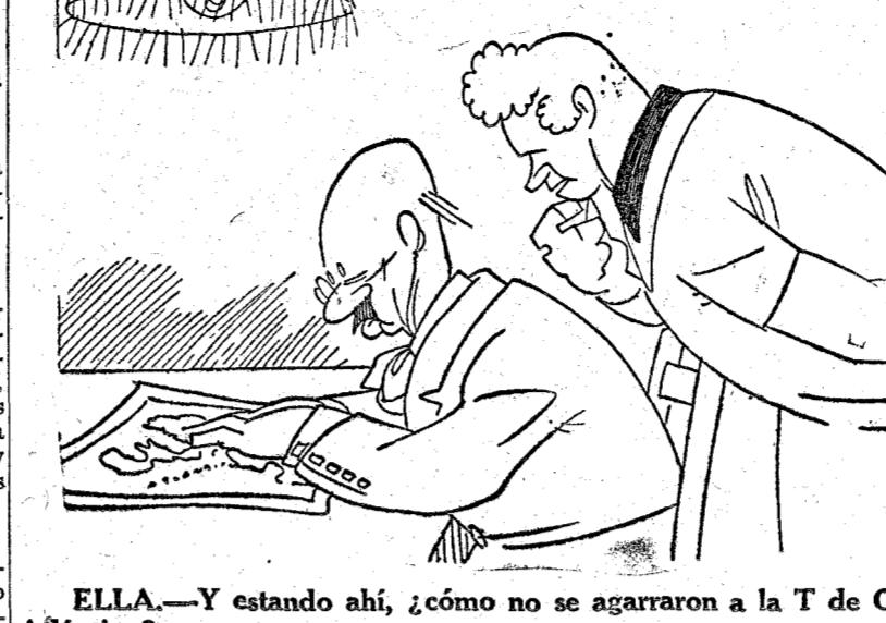
ELLA.—Y estando ahí, ¿cómo no se agarraron a la T de Océano Atlántico?