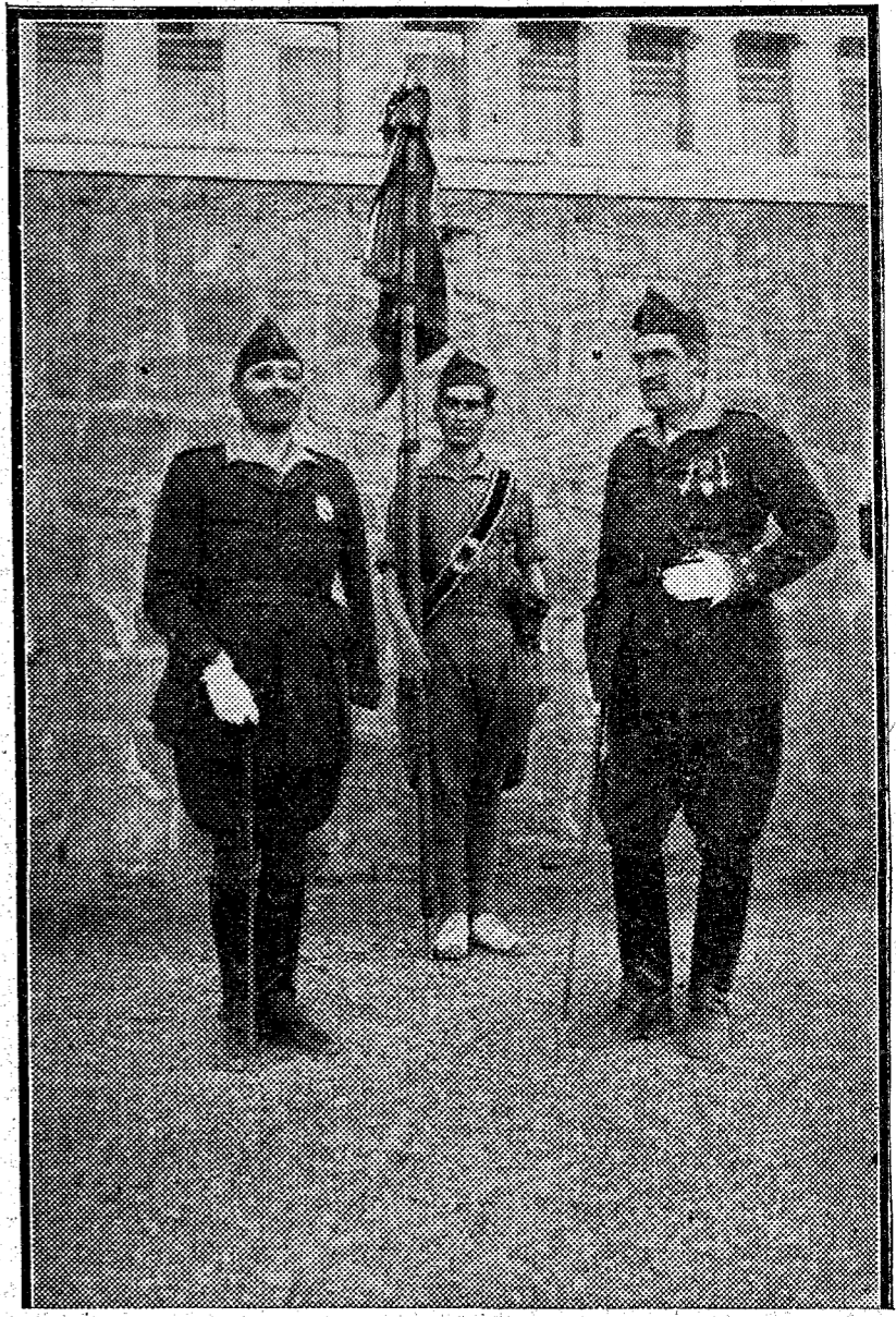
El general Millán Astray en el momento solemne de hacer entrega del mando de la Legión al nuevo coronel, señor Liniers, que tan heroicamente actuó en las pasadas campañas de Africa.—Abajo: Un grupo de jefes y oficiales, presidiados por Millán Astray, después de la entrega del mando.