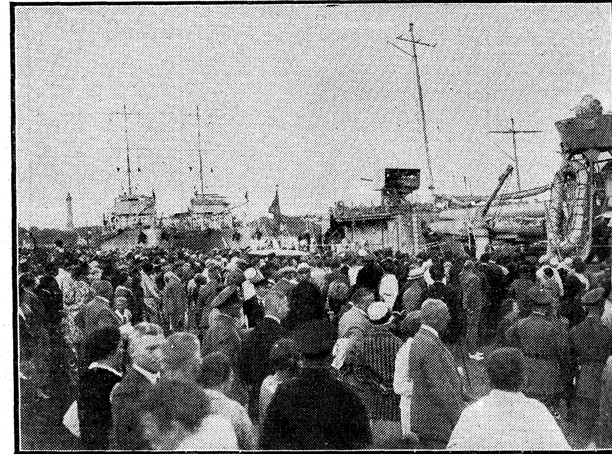
Llegada de los barcos de guerra españoles que hacen un crucero por el Norte al puerto alemán de Swinemunde.