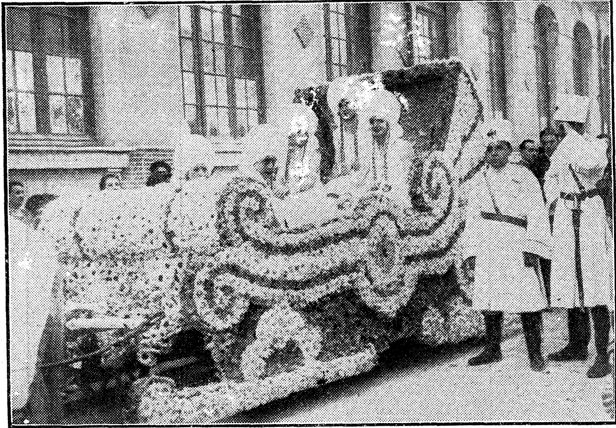
La carroza "Trineo", a la que se ha otorgado el primer premio en la batalla de flores celebrada en Laredo (Santander).