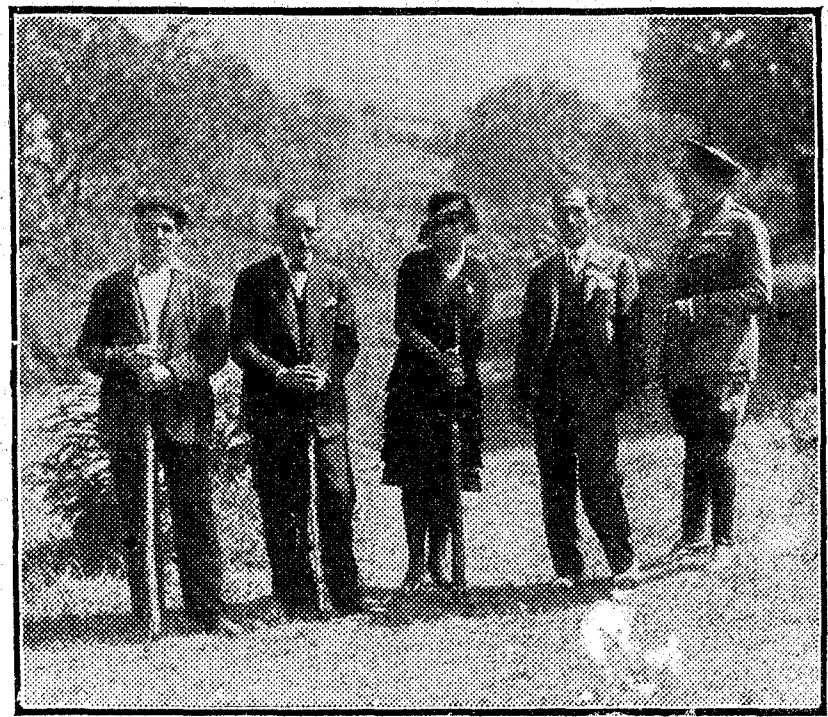
La madrina del Somatén de Tolosa con los tiradores que tomaron parte en la tirada.