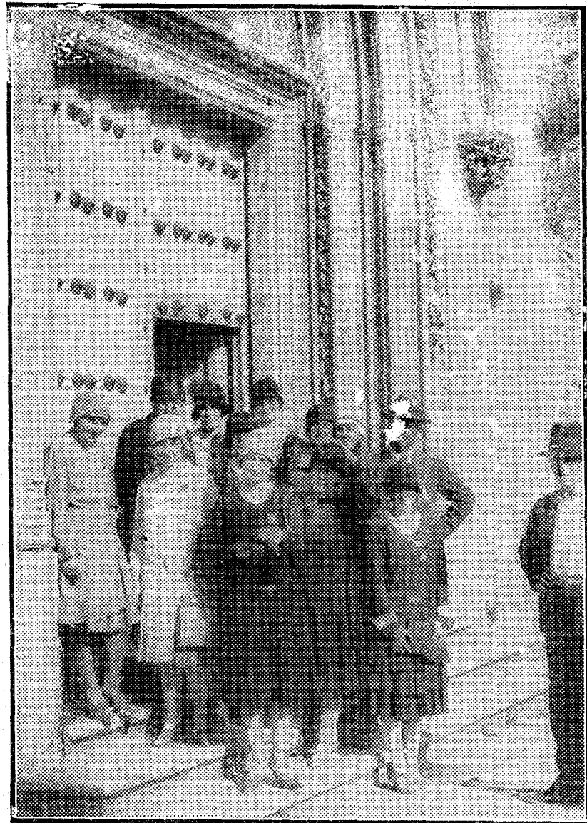
Un grupo de excursionistas sorianas visitando la Cartuja de Miraflores, de Burgos.