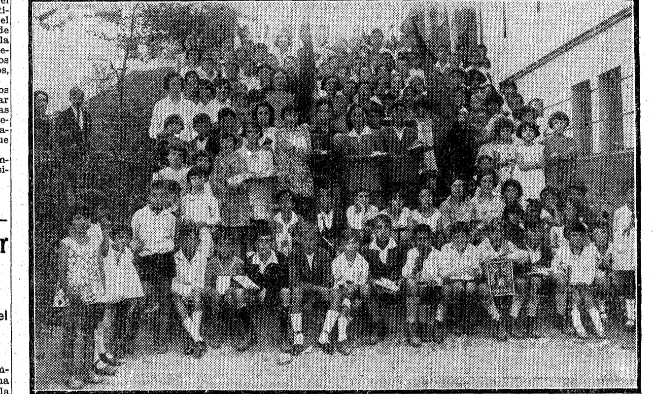
Los niños y niñas de las Escuelas Nacionales y el Asilo Municipal de La Coruña, que han sido premiados con libros, juguetes y libretas de la Caja de Ahorros con motivo de la apertura del nuevo curso.