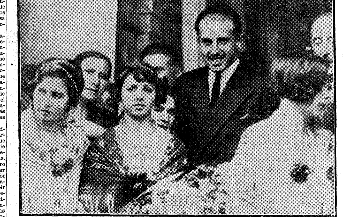
El infante don Jaime entre las obreras gijonesas, que le entregaron un ramo de flores