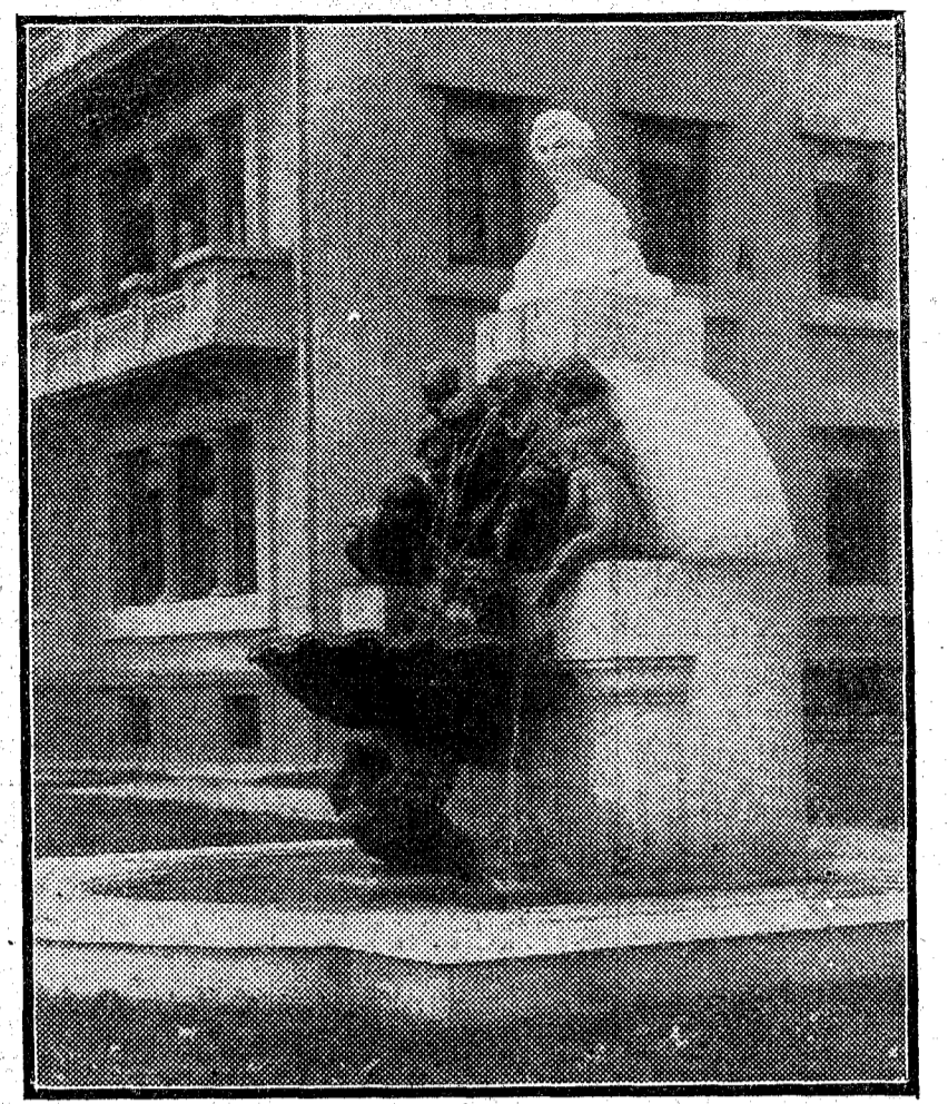
Fuente monumental, dedicada a la marquesa de Pelayo, construida en el "Jardín de la Infancia" de Santander y que será inaugurada hoy

LONDRES, 18.—Telegrafista de Lahore al "Times", que un ejército de 10.000 hombres, al mando de un general de Habibullah, marcha sobre Djelalabad y Kandahar, ciudades ocupadas actualmente por los partidarios de Nadir Khan. El emir Habibullah ha propuesto a su rival que la cuestión de la sucesión al trono de Afganistán sea discutida en Kabul por una asamblea de representantes de ambos pretendientes, a lo que parece opuesto Nadir Khan, temiendo una anagaza por parte de Habibullah.