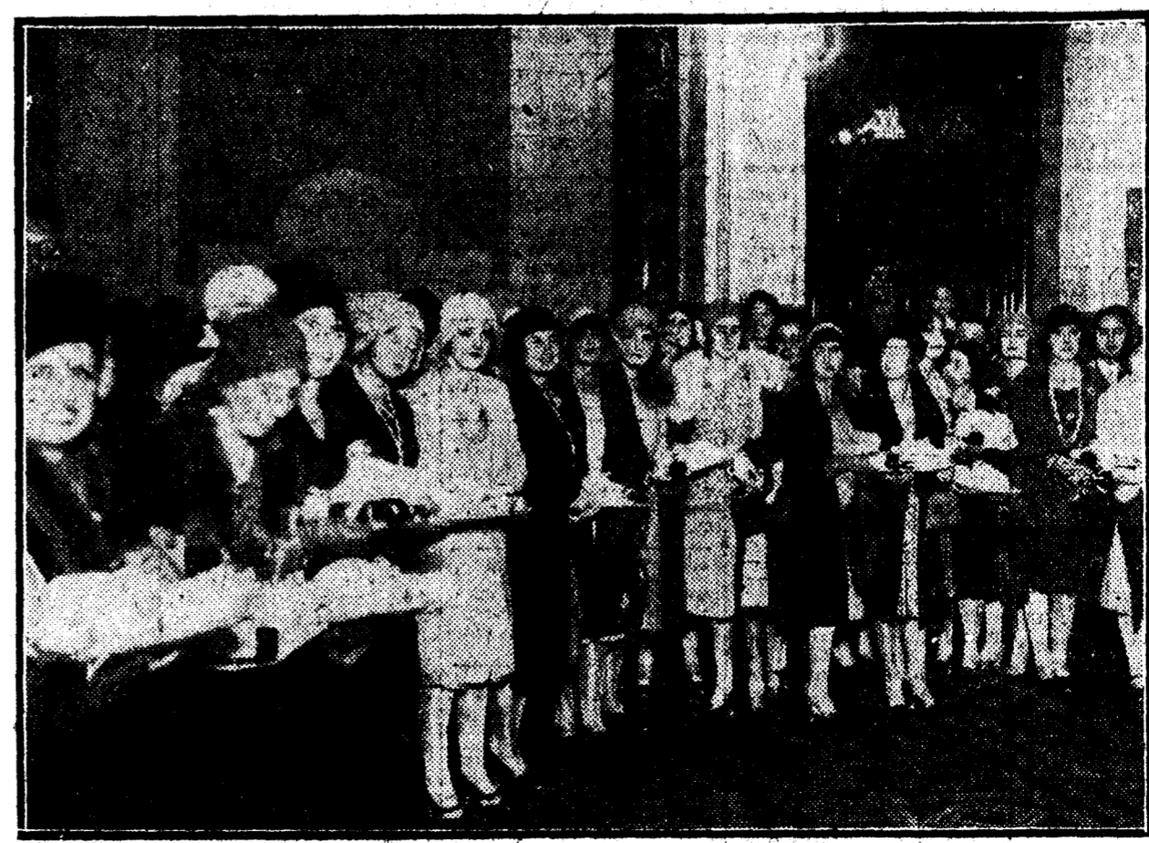
Señoritas de la buena sociedad coruñesa que repartieron meriendas a los ancianos y les acompañaron del brazo a recoger los premios en el Homenaje a la Vejez.

El ministro de Economía Nacional, señor conde de los Andes, nos ha remitido la carta siguiente: