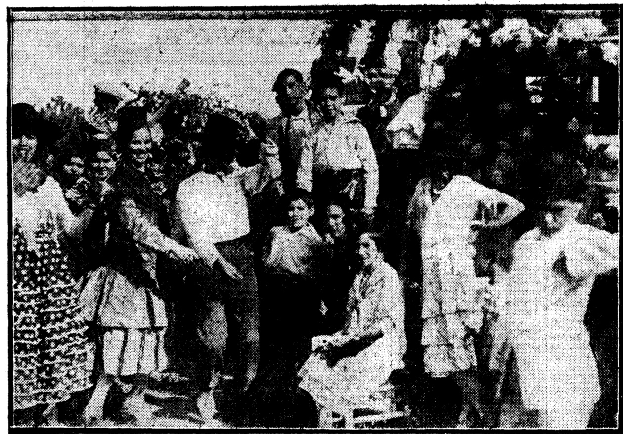
Típicos rómeros de la romería de Nuestra Señora de Valme, en Dos Hermanas (Sevilla), bailando las clásicas sevillanas.