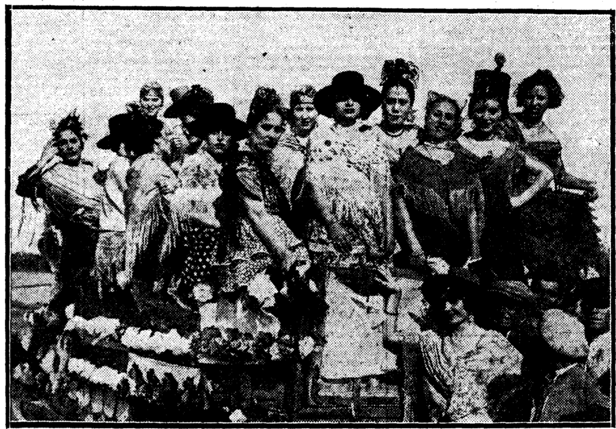
Una carreta de romeras, ataviadas con los trajes castizos, al dirigirse en romería a la ermita de Valme, en Sevilla.