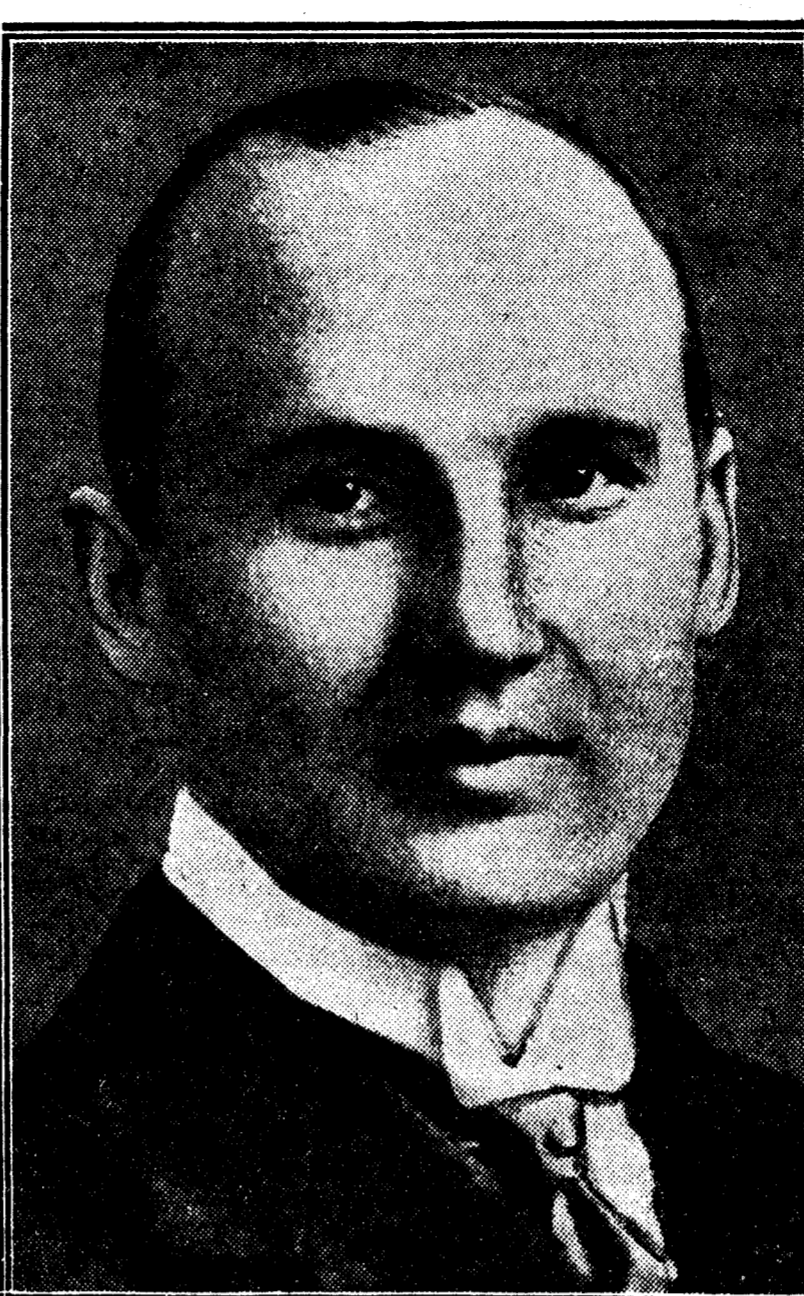
M. Ivar Kreuger, director del Trust secco de cerillas, que ha conseguido un empréstito al Gobierno alemán, a cambio del monopolio de fosforos.