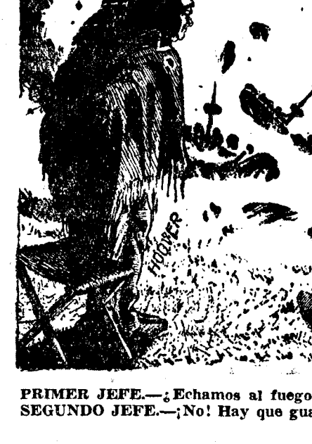
PRIMER JEFE.—¿Echamos al fuego también los barcos pequeños? SEGUNDO JEFE.—No! Hay que guardarlos para la próxima guerra. ("De Groene Amsterdammer")