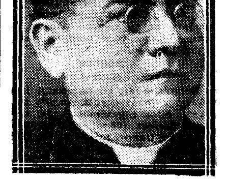
El Obispo de Guayana

El Obispo de Guayana nació en Mendoza, del Estado de Truguillo, en 1875. Fué párroco de Valera y, aparte de su intensa labor parroquial durante veintidós años, tiene en su haber la fundación y los veintidós años de dirección del Colegio de segunda enseñanza del Sagrado