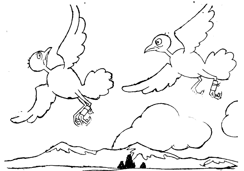
—Chica, llevo un dolor de barriga que no veo. —Baja; avería en el motor.