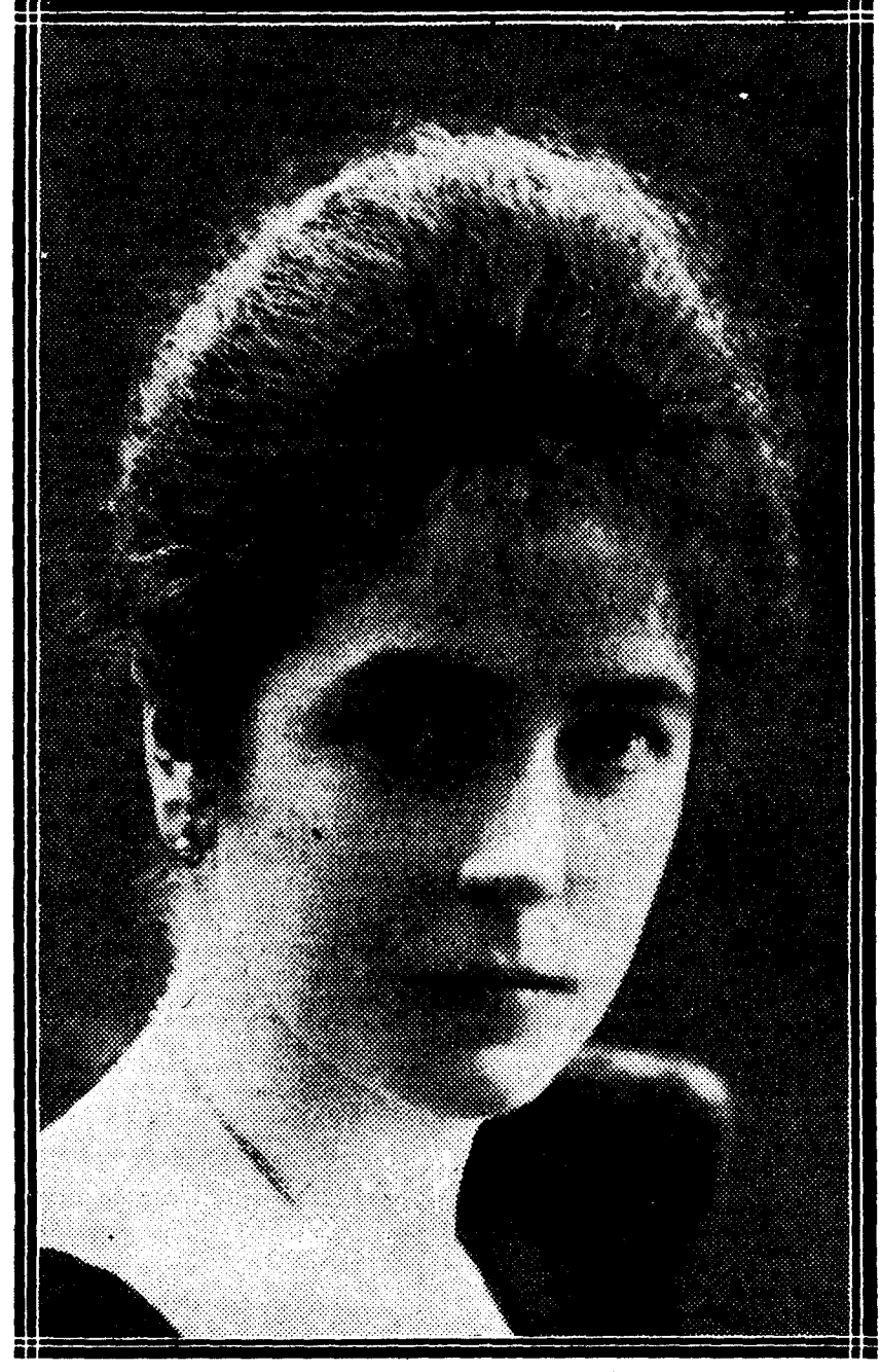
La condesa de Ribadavia, única española que ha visitado las regiones árticas, en las cuales llegó a la misma distancia del Polo que ahora se halla el general Nobile.

Doña Blanca Pérez de Guzmán, marquesa de Camarasa y condesa de Ribadavia, ha realizado numerosos viajes en compañía de su esposo, el aristócrata don Ignacio Fernández de Henestrosa. En uno de ellos fueron al Polo Norte. Tres mujeres pisaron por primera vez en la historia del mundo las tierras árticas de Francisco José; una de ellas fué la condesa de Ribadavia. Estuvo a igual distancia del Polo de la que se encuentra ahora el general Nobile y a 400 kilómetros del punto donde el aviador italiano espera socorros. Al ver la delicada figura de esta dama cuesta trabajo creer que no sólo habitó entre los hielos polares, sino que allí dió muerte a cuatro enormes osos.