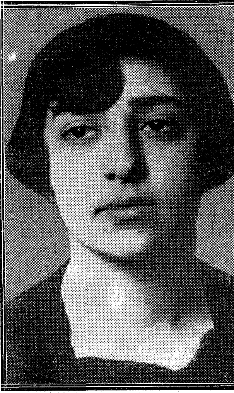
La futura esposa de Mustafá Kemal, cuñada del Rey del Afghanistan.