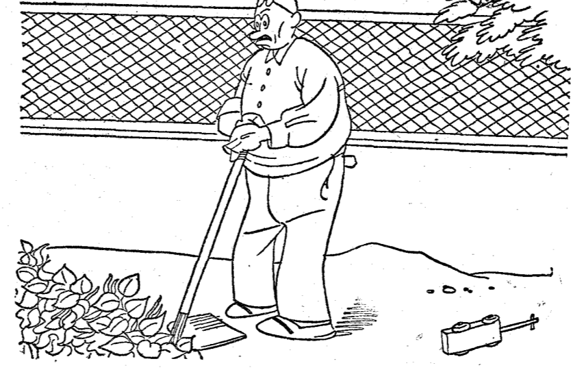
—Pues, señor, el caso es curioso. Yo planté judías blancas y ahora me salen judías verdes.