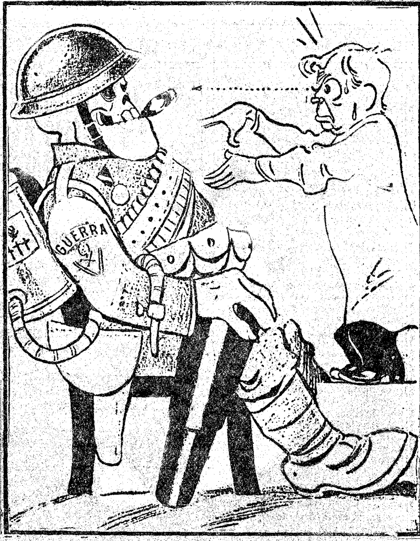
HIPNOTISMO EN PARIS.—KELLOGG: Usted ha sido prohibida. Usted está desde ahora fuera de la ley. Usted ya no existe. ("Izvestia", Moscú.)