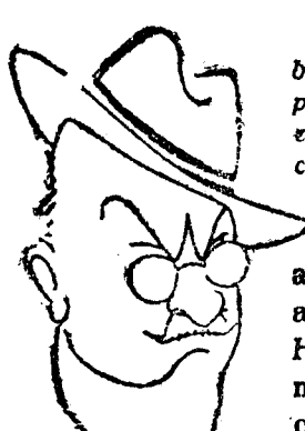
Alejandro Lerroux, gran caudillo republicano y maravilloso orador, que supo, por la sola fuerza de su personalidad, elevarse desde las más modestas posiciones a la dirección de un partido.

Idem de conversión de títulos de la Deuda al 4 por 100 interior, hasta el número 1.038.