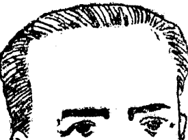
Santiago Alba, jefe ilustre de la extrema izquierda montañesa. Sus profundos conocimientos de la economía nacional hacen de él una legítima esperanza para cuantos aspiran a una transformación radical de la misma.

"¿Quién negará la utilidad de una enciclopedia, y quién podrá blasonar de no haberse visto precisado a consultar en muchas ocasiones alguna de las publicadas? Cuando están concienzuda y esmeradamente formadas, como la que editó la Casa Montaner y Simón—digna por ello de aplauso y aliento—, suministran esas obras a cuantos trabajamos en el periodismo en las profesiones liberales y en la política, ahorrándonos tiempo y enojosa tarea de búsqueda, el dato histórico, literario o geográfico que necesitamos de momento, y son fuente segura donde ilustrarnos acerca del tecnicismo de ciencias o artes que no nos sean familiares; porque, dada la complejidad, cada día mayor, de los conocimientos humanos, nadie alardeará ni aun de estar iniciado de todos ellos."