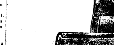
Número 278.—Precio, 60 céntimos.