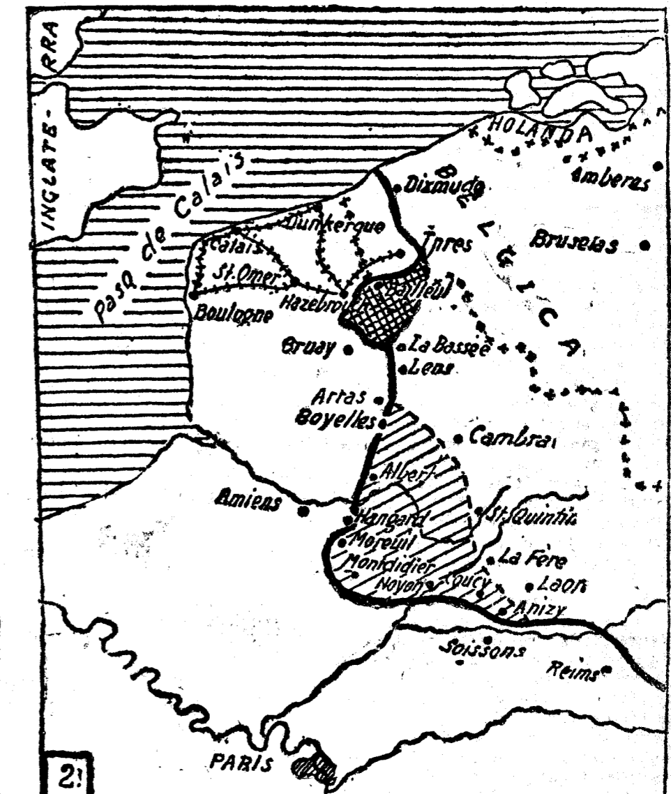
Escala 0. 20. 40. 60. 80. 100. Posición de los alemanes en 21 de Marzo último. Zona conquistada hasta el 7 de Abril. Id. id. desde el 9 al 16 id.