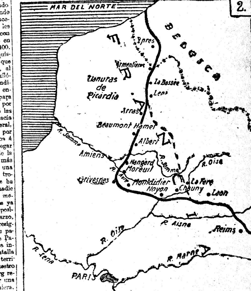
Escala - Kilómetros. Posición que ocupaban los alemanes el 21 de Marzo. Posición aproximada actual.