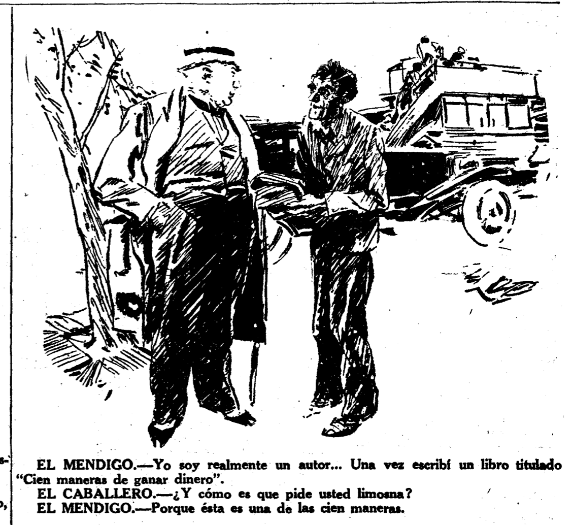
EL MENDIGO.—Yo soy realmente un autor... Una vez escribí un libro titulado "Cien maneras de ganar dinero". EL CABALLERO.—¿Y cómo es que pide usted limosna? EL MENDIGO.—Porque ésta es una de las cien maneras. ("Passing Show", Londres.)