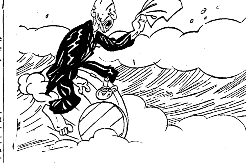
—¿Qué idiota es ese barco! Me ve agitar el pañuelo y se pone a dar vueltas. ¡A lo mejor cree que pido la roja!