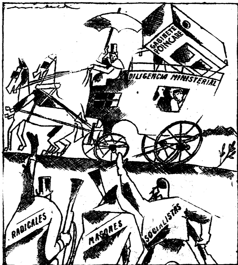
EL SECRETARIO DEL MINISTRO.—¡Nos atacan! Me parece que vamos a perecer. POINCARÉ.—¡No, hombre! Esos se contentan con la cartera.