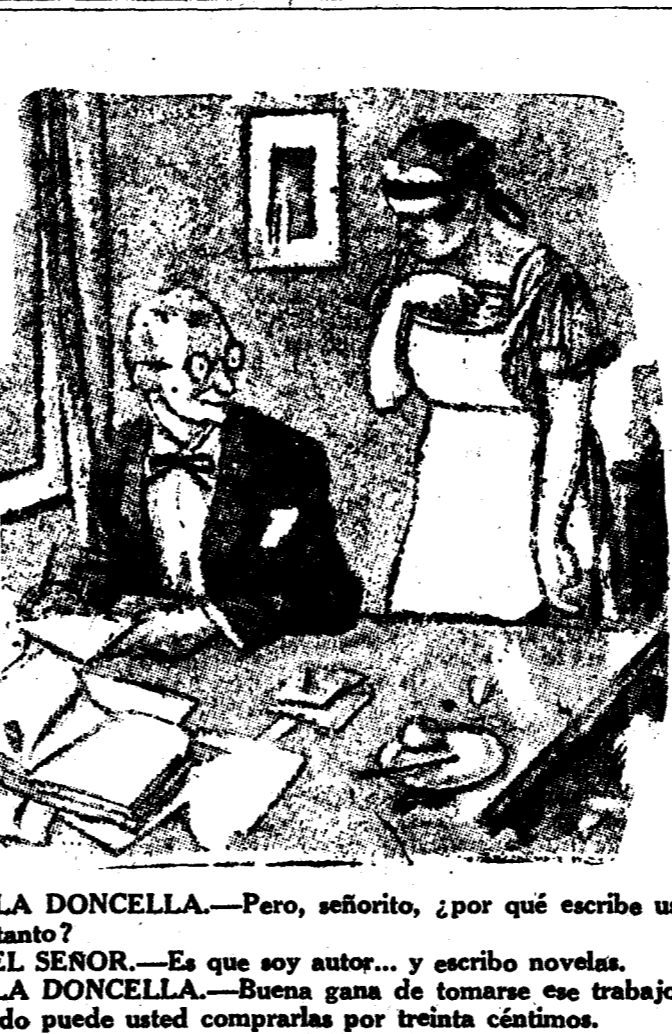
LA DONCELLA.—Pero, señorito, ¿por qué escribe usted tanto? EL SENOR.—Es que soy autor... y escribo novelas. LA DONCELLA.—Buena gana de tomarse ese trabajo, cuando puede usted comprarlas por treinta céntimos. ("Fliegende Glatte", Munch.)