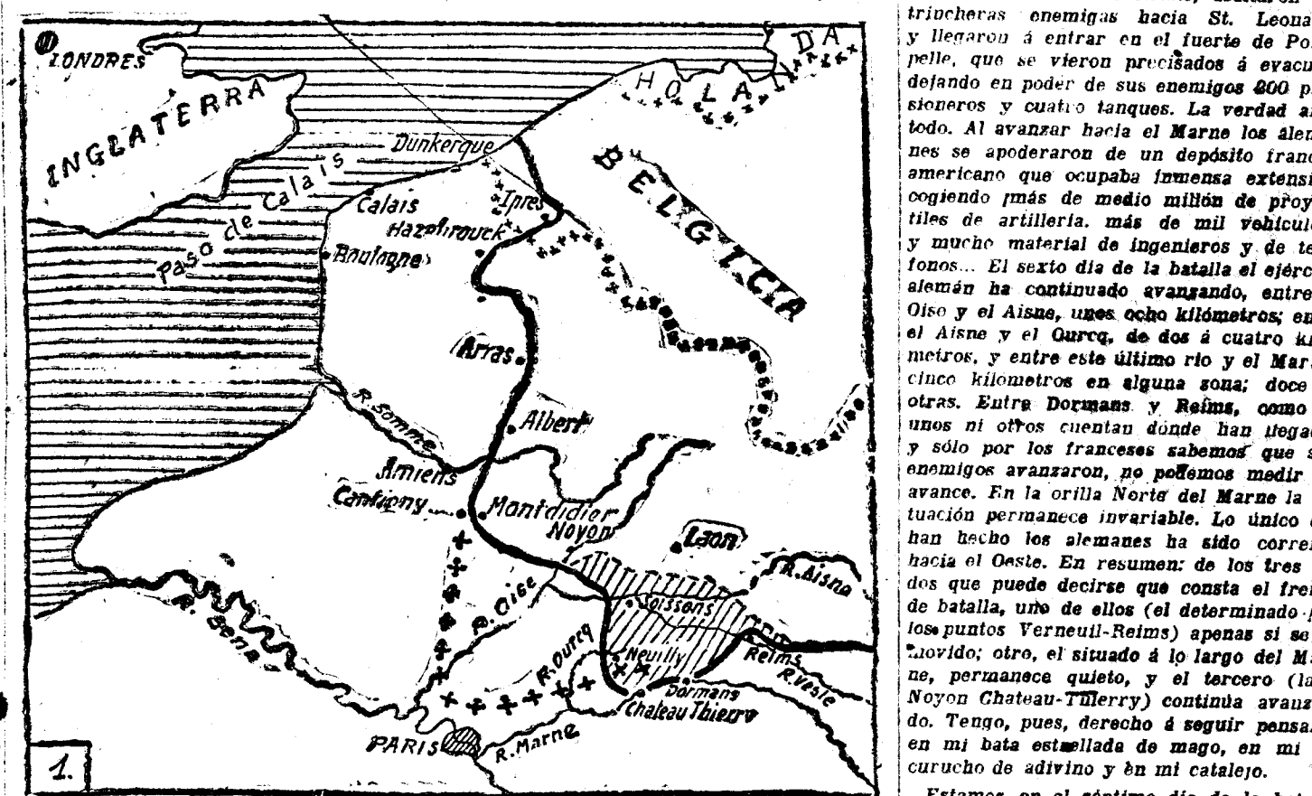
Posición de los alemanes en la madrugada del 27 de Mayo. Id id id id en la noche del 1 de Junio. Id id id id que acaso pretendían ocupar como consecuencia de su ofensiva.

Touvent y las líneas adversarias al Oeste de Noyon. Los franceses responden que tuvieron tentativas en extremo violentas en la lina Norte del bosque de Carlepoint y de Moutin-sous-Touvent, rechazando al enemigo al Norte de dichos pueblos. ¿Que si está claro? Pues no lo está. Porque a continuación los mismos franceses aseguran que conquistaron sus enemigos el monte de Choisy, y que, contrarrestados des-