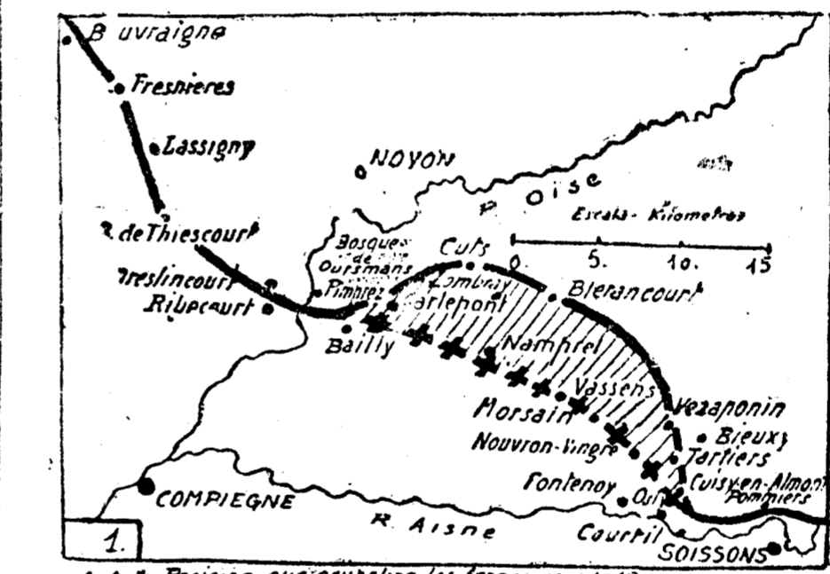
Posición que ocupaban los franceses el 19. Id id id el 20. Zona reconquistada por los franceses.

llevarlos en volandas; avanzan ahora, y no he de regatearles un centímetro de terreno, aunque piense, como pienso, que estos éxitos parciales que obtienen servirán solo para acercarlos á la línea que hayan escogido los alemanes para detenerse. Cuando éstos entiendan que ha llegado el momento de hacer alto, dejare de dibujar avances de sus enemigos.