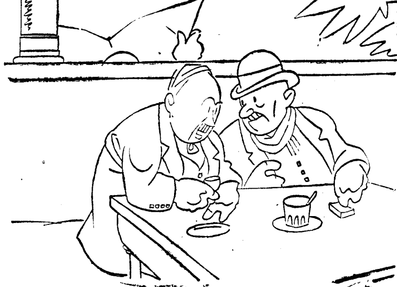
—¡Ca, hombre, ca! Este año los disfraces que más se van a llevar son los de hombres nuevos.