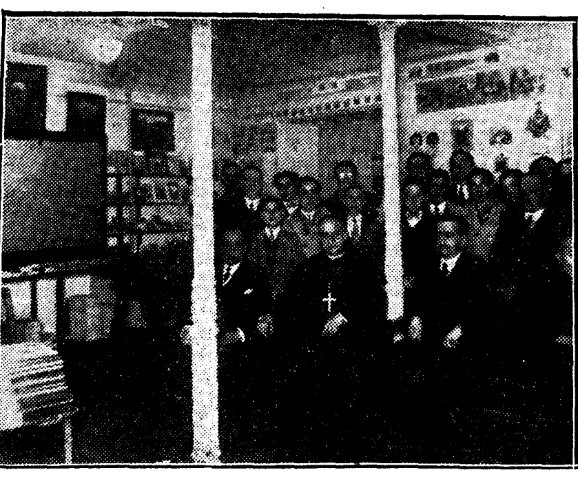
El excelentísimo e ilustrísimo señor Obispo de Madrid-Alcalá, doctor Leopoldo Eijo y Garay, presidiendo la sesión científica que se ha celebrado en el SALON ESCOLAR DE VOLUNTAD (Alcalá, 28, entrecurro) para dar a conocer a los alumnos del magisterio de la "Institución del Divino Maestro" varios aparatos electro-físicos y novísimas películas instructivas.

WASHINGTON, 21.—El Senado en su sesión de hoy, ha aprobado el mantenimiento de los derechos, ya elevados, que para las almendras establece el proyecto de ley relativo a las tarifas arancelarias remitido por la Cámara de Representantes, después de rechazar la petición de nuevos aumentos solicitada por los agricultores californianos.—Associated Press.