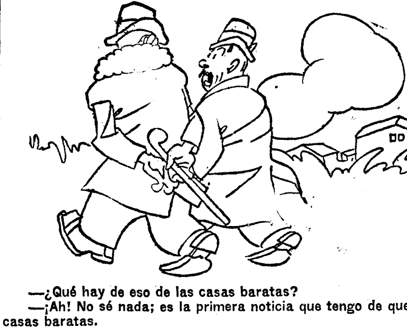
—¿Qué hay de eso de las casas baratas? —¡Ah! No sé nada; es la primera noticia que tengo de que había casas baratas.