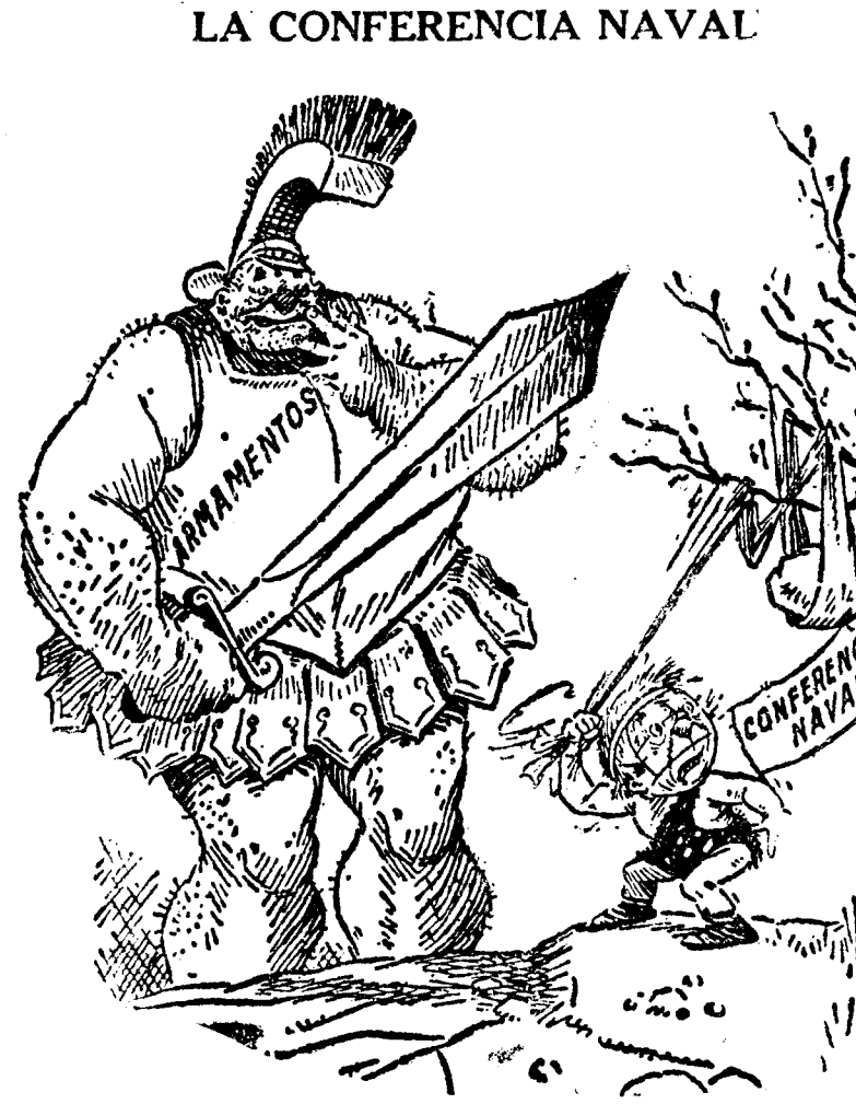
A David se le ha enredado la honda.

El acto terminó a la una de la tarde. El público salió lleno de entusiasmo y haciendo grandes elogios de los cuatro grandes discursos allí pronunciados.