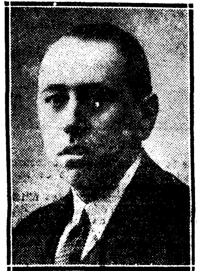
DON JOSE MARIA GIL ROBLES