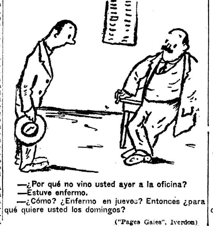
(“Pages Gaies”, Iverdon)

Dice el conde de los Andes El ex ministro conde de los Andes ha manifestado que, aunque él suscribe el homenaje rendido al marqués de Estella, respecto al manifiesto lanzado por la Unión Monárquica, le parece más eficaz que ese núcleo que se inició a no integrarse un partido político en sentido estricto. Por este motivo se declara partidario de un gran bloque monárquico, y de no aceptar la disciplina de un partido. Desea volver a tener su antigua significación, que no obstante su colaboración con el general Primo de Rivera, le obliga, desde hace muchos años, a practicar esa política, se declara partidario de un gran bloque monárquico, no aceptando, pues, la disciplina de un grupo,