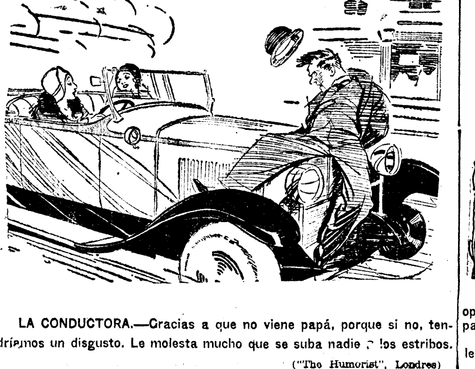
(“The Humourist”, Londres)