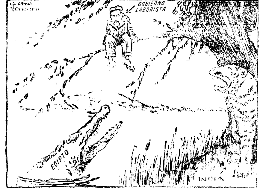
NI siquiera el árbol entero para sostenerse ("Dublin Herald")