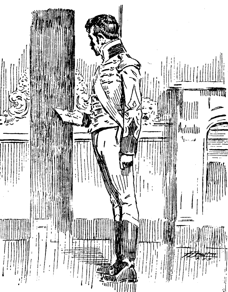
Juraría—se dijo tratando de recordar—.

—Juraría—se dijo tratando de recordar—, que yo dejé el paquete de cartas en la tabla de arriba del armario y no en la inferior, donde acabo de en-