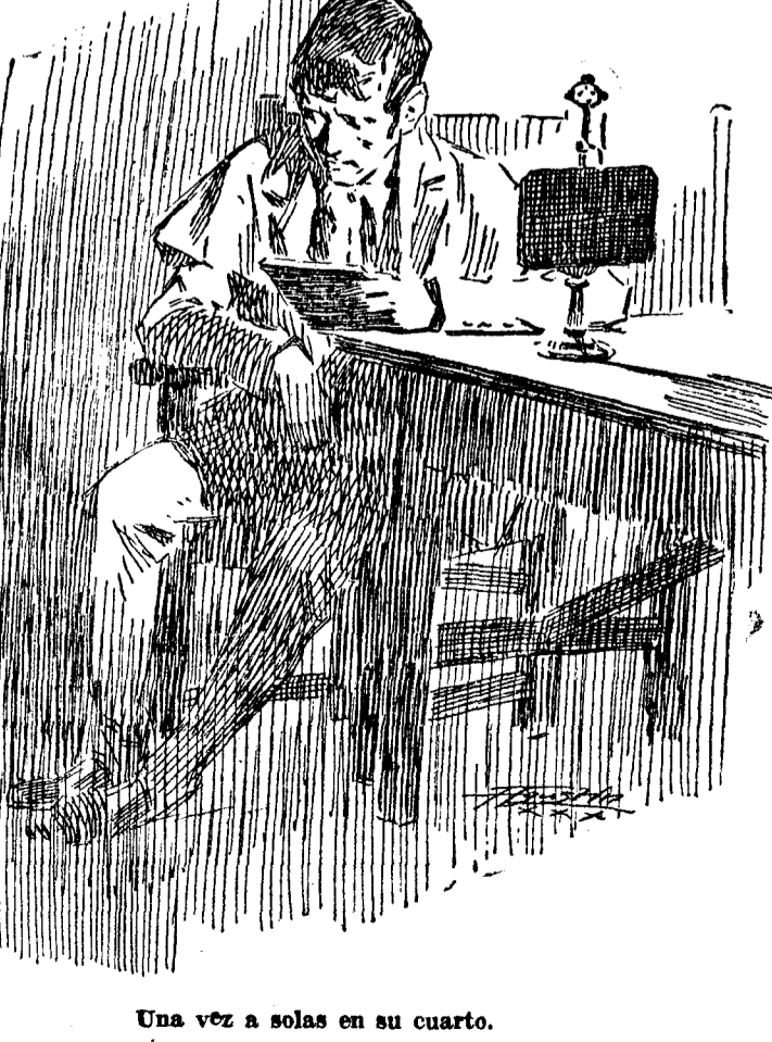
Una vez a solas en su cuarto.