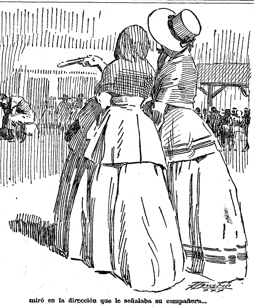
miró en la dirección que le señalaba su compañera...

petuoso a la imagen de su madrina, que llevaba al cuello pendiente de una cadentia. El "White Star" hizo su entrada en el Havre a media mañana de un día de agosto radiante y esplendoroso. El mar y el cielo eran igualmente azules. Y ni en la superficie líquida se advertía el más insignificante oleaje, ni el firmamento aparecía maculado por la menor nubecilla. De vez en vez, la diafanidad del aire quedaba manchada por las columnas de humo negro que se escapaban de las chimeneas del vapor de "Southampton", que ultimaba sus preparativos de marcha y que levó anclas en el preciso instante en que el yate atracaba al muelle. Las pasajeras del "White Star" desembarcaron, acto seguido; era domingo, y lady Mary y su dama de compañía se dispusieron a ir a misa. Heliona, refrenando sus ímpetus juveniles, que la impulsaban a caminar deprisa, atemperó su paso al de la inglesa,