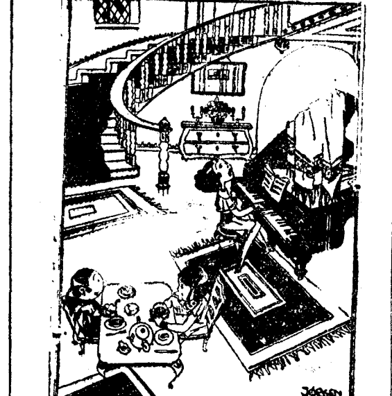
—Mi hija ha heredado toda mi voz. —¿Qué contenta estará usted de haberse casado! ("Everybody's", Londres)