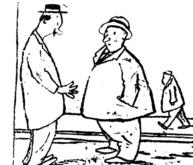
—Ha recibido un anónimo en el que me llaman "imbecil". —Debe ser de alguno que te conoce. ("Pages Gates", Iverdon)