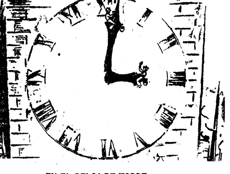
EN EL RELOJ DE TORRE. EL OBRERO QUE ESTA EN EL HORARIO (al del minuterero).—¡Oye! Dame un cigarrillo. EL DEL MINUTERO.—Espérate un cuarto de hora. ("Life", N. York)