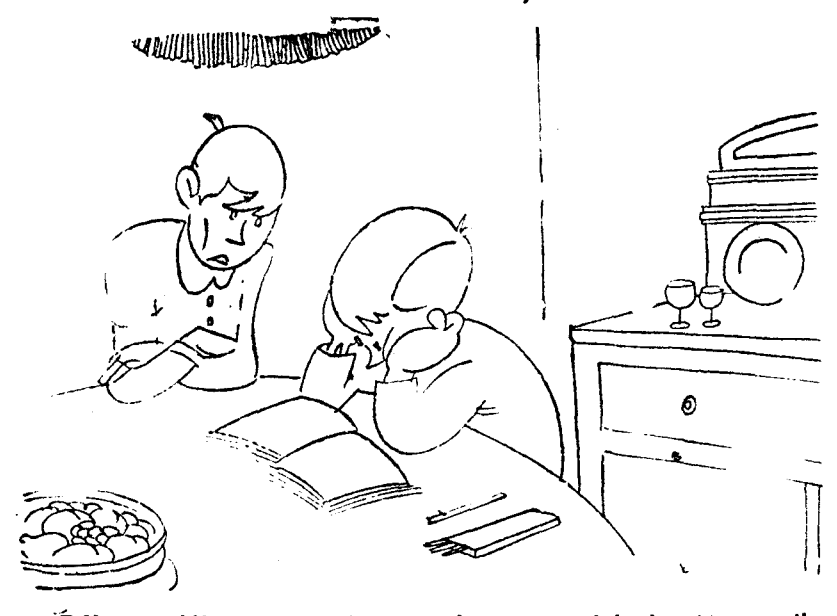
—Déjame, déjame, que si ve papá que no sé la lección me lleva a ver películas de la guerra.