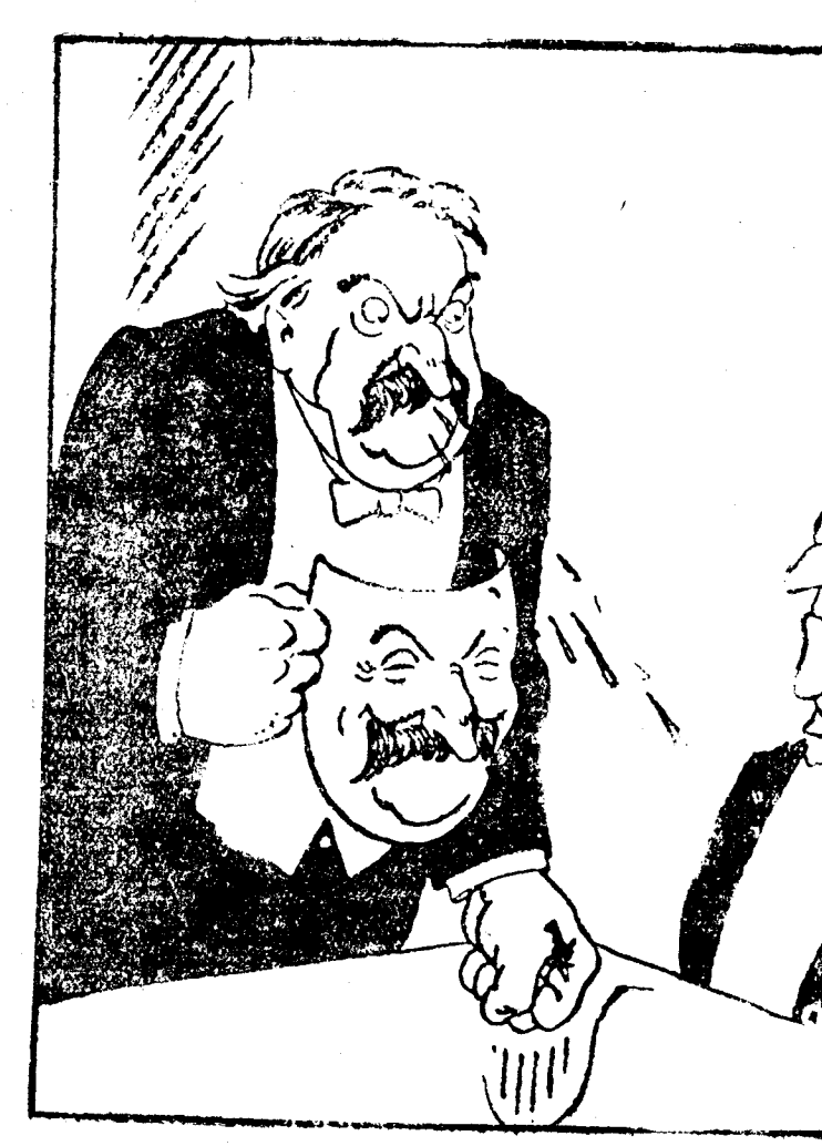
VERSALLES Y LOCARNO