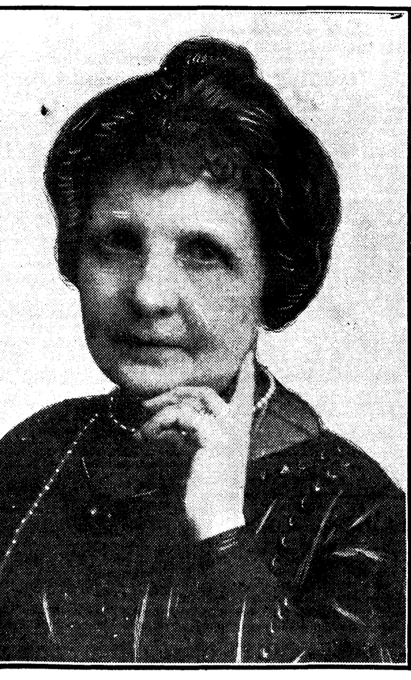
Doña Blanca de los Ríos, viuda de Lampérez, para quien se ha pedido la medalla de oro del Trabajo

Doña Blanca de los Ríos encanace en la vida, después de haber encanecido también en las tareas constantes del trabajo intelectual. Pocas figuras femeninas de nuestro siglo llegan a la ancianidad con un haber tan prestigioso como el de esta ilustre escritora hispalense.