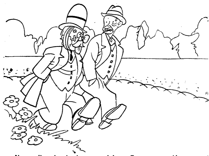
—No, no llegué a batirme con López. Pero me arrojó un guante. —Chico, pues sería de Primo Carnera, ¿verdad?