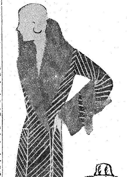
Abrijo en seda rayada marrón, guarnecido de armiño "beige".