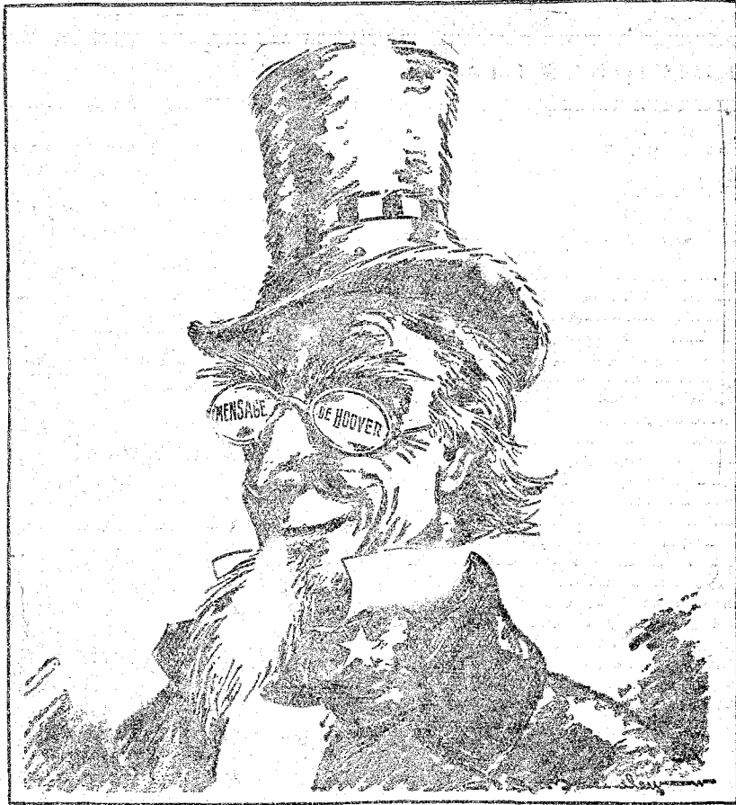
LAS GAFAS DEL OPTIMISTA

todo, es el único que se halla en condiciones de hacer unas elecciones con todas las garantías posibles de sinceridad. Opina, por su parte, el señor Silió que el futuro Parlamento ofrecerá una fisonomía análoga a los anteriores. En cuanto a los partidos políticos tradicionales, los cree sin vida y por ello se trata de sustituirlos con organizaciones de grandes fuerzas aínas.