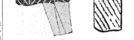
Para la tarde el traje claro debajo del abrigo oscuro es la solución ideal. Con un traje-sastre negro se puede llevar una blusa de un rojo anaranjado vivo. Las faldas verde esmeralda—el verde esmeralda hace cada vez más progresos—se aitan muy bien con los abrigos negros. Ved, pues, como un mismo abrigo o un mismo traje puede pasar por una toaleta diferente.