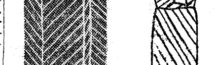
Abrijo de buen corte pero de poco coste, con una blusa verde.