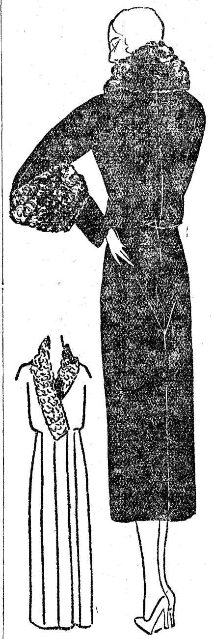
Abrijo ligeramente blusado. Incrustaciones en punta, apoyándose sobre las caderas. Cuello y adornos de manga, de astracán negro. Modelo Philippe & Gaston

secretos que se llevan los preparativos de las nuevas modas. Sin embargo, puedo anticipar que el traje por la noche seguirá largo, hasta los pies, y por el día, como hay que amoldarse a las necesidades de la vida actual, la falda no puede ser tan larga.